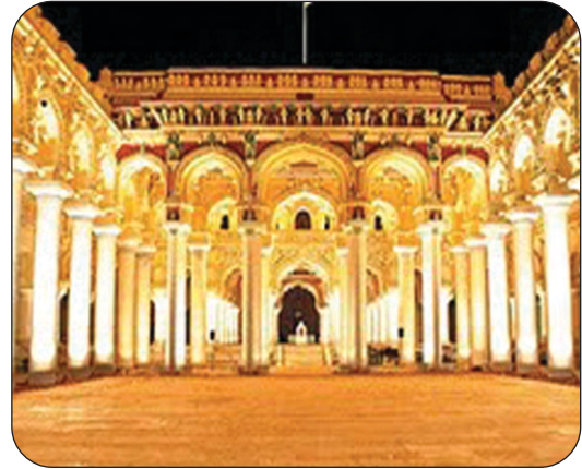
திருமலை நாயக்கர் மகால்

திருமலை நாயக்கருக்குப் பிறகு ஆட்சி செய்த சிறந்த அரசி மங்கம்மாள் ஆவார். இராணி மங்கம்மாள், சொக்கநாத நாயக்கரின் மனைவியாவார். தமது மூன்று வயது பேரனான விஜயரங்க சொக்கநாதரின் பாதுகாவலராக (பகர ஆளுநர்) ஆட்சிப் பொறுப்பேற்றார்.