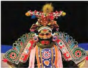
Purisai Duraisami Kannappa Thambiran

You might have seen us dancing on the streets and in the open air. Our performances are usually between the months of Panguni [March-April] and Aadi [July-August]. We tell stories, sing songs, dance and create our own dialogue in shows. We begin the show late in the evening and continue throughout the night. We wear traditional costumes, rich in colour. We use face masks, head and shoulder gear and shields too. The harmonium, mridangam and cymbals are our musical accompaniments. The Central and State Governments encourage us in many ways. Have you seen a Therukoothu? Purisai is a small village in Thiruvannamalai district famous for this art form and Duraisami Kannappa Thambiran is a well - known Therukoothu artist. Would you like to try making one of our masks?