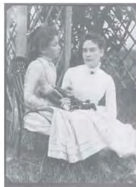
Young Helen and Anne Sullivan

explore : to examine something completely