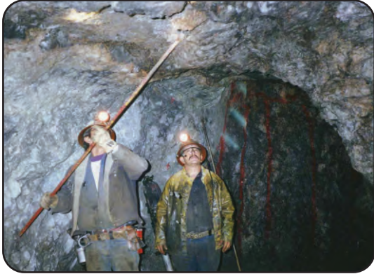
படம்-24. நிலத்தடி சுரங்கத் தொழில்

நிலத்தடி சுரங்கத்தொழில் முறையில் தாதுக்கள் புவிக்கு உட்பகுதியில் அதிக ஆழத்திலிருந்து வெட்டியெடுக்கும் செயல்முறை மேற்கொள்ளப்படுகிறது. இம்முறை திறந்த வெளி சுரங்கத்தொழில் முறையைக் காட்டிலும் செலவு அதிகமாகும் முறையாகும். பாதுகாப்பு மற்றும் முன் எச்சரிக்கை நடவடிக்கைகள் நிலத்தடி சுரங்கத்தொழிலில் மிக முக்கியமானதாகும் (படம்-24).