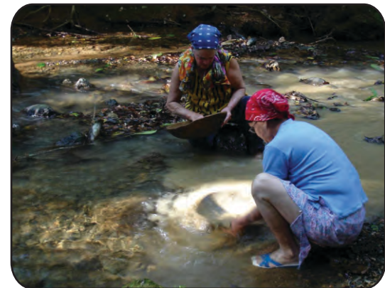
படம்-23 வண்டல் பிரித்தெடுக்கும் முறை-தங்கம்

வண்டல் பிரித்தல் முறை என்பது கனிமங்களை சலித்தோ, சுழற்றியோ,