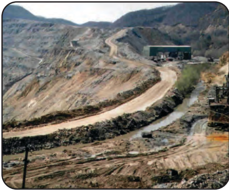
படம்-21. திறந்தவெளி முறை

கனிமங்கள் பல வழிமுறைகளின் மூலம் தோண்டி எடுக்கப்படுகின்றன. கனிமங்கள் கிடைக்கப்பெறும் இடத்தைப் பொறுத்துப் புவியின் மேற்பரப்பிலோ அல்லது அதற்கு அடுத்த பகுதியிலோ கிடைக்கும் கனிமங்கள் வெட்டி எடுக்கப்படுகின்றன.