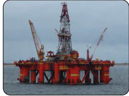
படம் 25 எண்ணெய் எடுக்கும் மேடை அமைப்பு மற்றும் கோபுர கட்டமைப்பு

துளையிடுதல் முறை மூலமாக கச்சா எண்ணெய் மற்றும் இயற்கை வாயு ஆகிய எரிபொருள் கனிமங்கள் துளைத்து எடுக்கப்படுகின்றன. எண்ணெய் கிணறுகளில் இருந்து துளைத்து எண்ணெய் எடுக்க எண்ணெய் ரிக்(Rigs) எனப்படும் ஒருவகை மேடையைப் பயன்படுத்துவர். துளையிட்டு எண்ணெய் எடுக்கும் எண்ணெய் வயல்கள் இருக்கும் இடங்களை, அங்கு காணப்படும் டெரிக் (derricks) எனப்படும் இயந்திரங்களினால் ஆன கோபுரம் போன்று தோற்றமளிக்கும் கட்டமைப்புகளைக் கொண்டு காணலாம் (படம்.23).