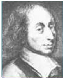
ब्लेज पास्कल (1623-1662) आकृति 15.1