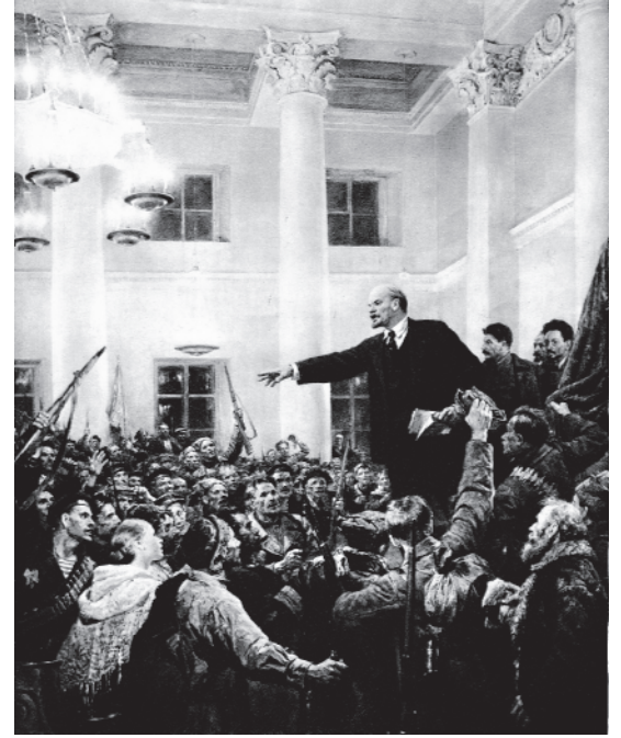
चित्र 9 - अप्रैल 1917 में मज़दूरों को संबोधित करते लेनिन की एक बोल्शेविक छवि.

गांवों में किसान और उनके समाजवादी क्रांतिकारी नेता भूमि पुनर्वितरण के लिए दबाव डालने लगे थे। इस काम के लिए भूमि समितियाँ बना दी गई थीं। सामाजिक क्रांतिकारियों से प्रेरणा और प्रोत्साहन लेते हुए जुलाई से सितंबर के बीच किसानों ने बहुत सारी ज़मीन पर कब्ज़ा कर लिया।