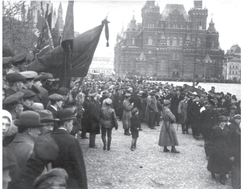
चित्र 13 - मास्को में मई दिवस का प्रदर्शन, 1918 .