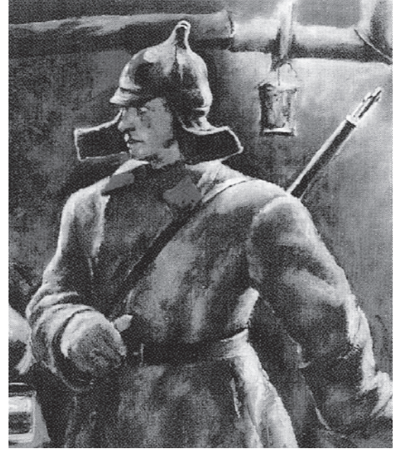
चित्र 12 - सोवियत टोपी ( बुदियोनोव्का ) पहने एक सिपाही .

बोल्शेविक पार्टी का नाम बदल कर रूसी कम्युनिस्ट पार्टी (बोल्शेविक) रख दिया गया। नवंबर 1917 में बोल्शेविकों ने संविधान सभा के लिए चुनाव कराए लेकिन इन चुनावों में उन्हें बहुमत नहीं मिल पाया। जनवरी 1918 में असेंबली ने बोल्शेविकों के प्रस्तावों को खारिज कर दिया और लेनिन ने असेंबली बर्खास्त कर दी। उनका मत था कि अनिश्चित परिस्थितियों में चुनी गई असेंबली के मुकाबले अखिल रूसी सोवियत कांग्रेस कहीं ज्यादा लोकतांत्रिक संस्था है। मार्च 1918 में अन्य राजनीतिक सहयोगियों की असहमति के बावजूद बोल्शेविकों ने ब्रेस्ट लिटोव्स्क में जर्मनी से संधि कर ली। आने वाले सालों में बोल्शेविक पार्टी अखिल रूसी सोवियत कांग्रेस के लिए होने वाले चुनावों में हिस्सा लेने वाली एकमात्र पार्टी रह गई। अखिल रूसी सोवियत कांग्रेस को अब देश की संसद का दर्जा दे दिया गया था। रूस एक-दलीय राजनीतिक व्यवस्था वाला देश बन गया। ट्रेड यूनियनों पर पार्टी का नियंत्रण रहता था। गुप्तचर पुलिस (जिसे पहले चेका और बाद में ओजीपीयू तथा एनकेवीडी का नाम दिया गया) बोल्शेविकों की आलोचना करने वालों को दंडित करती थी। बहुत सारे युवा लेखक और कलाकार भी पार्टी की तरफ़ आकर्षित हुए क्योंकि वह समाजवाद और परिवर्तन के प्रति समर्पित थी। अक्टूबर 1917 के बाद ऐसे कलाकारों और लेखकों ने कला और वास्तुशिल्प के क्षेत्र में नए प्रयोग शुरू किए। लेकिन पार्टी द्वारा थोपी गई सेंसरशिप के कारण बहुत सारे लोगों का पार्टी से मोह भंग भी होने लगा था।