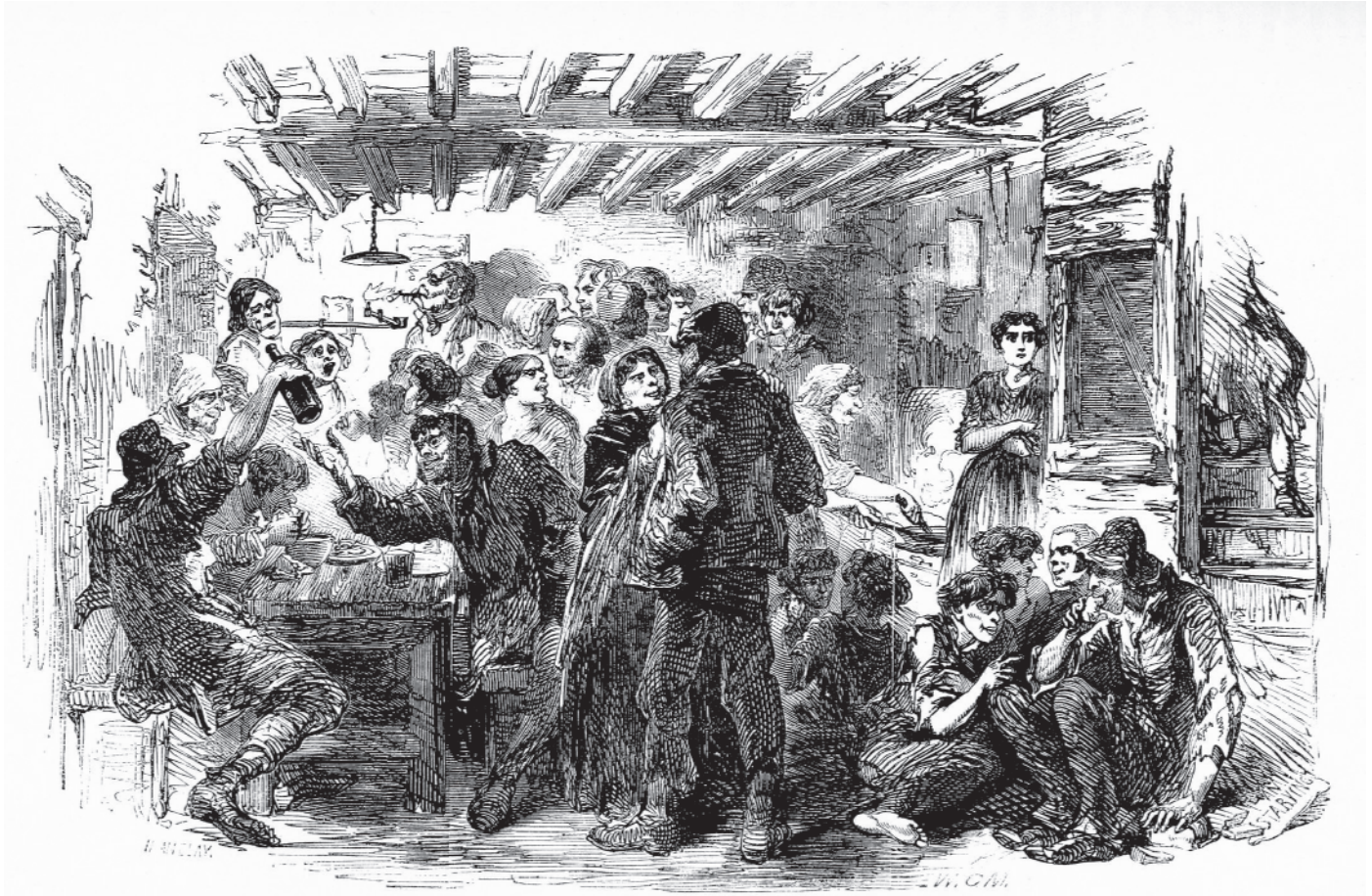
चित्र 1 - उन्नीसवीं शताब्दी के मध्य में लंदन के गरीबों की दशा उसी समय के एक व्यक्ति की दृष्टि से.

स्रोत : हेनरी मेह्यू, लंदन लेबर ऐन्ड लंदन पुअर, 1861