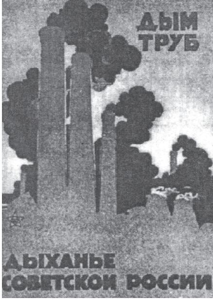
चित्र 14 - कारखानों को समाजवाद के प्रतीक की तरह माना जाता था। पोस्टर में लिखा है : 'चिमनियों से निकलता धुआँ ही सोवियत रूस की साँस है।'