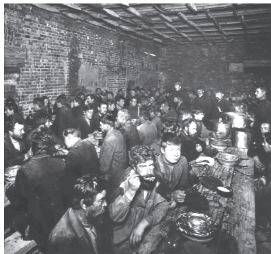
चित्र 5 - युद्ध से पहले सेंट पीटर्सबर्ग में बेरोज़गार किसान. बहुत सारे लोग धर्मार्थ लंगरों में खाना खाते थे और खस्ताहाल मकानों में रहते थे।

सामाजिक स्तर पर मजदूर बँटे हुए थे। कुछ मजदूर अपने मूल गाँवों के साथ अभी भी गहरे संबंध बनाए हुए थे। बहुत सारे मजदूर स्थायी रूप से शहरों में ही बस चुके थे। उनके बीच योग्यता और दक्षता के स्तर पर भी काफी फ़र्क था। सेंट पीटर्सबर्ग के एक धातु मजदूर ने कहा था : 'धातुकर्मी मजदूरों में खुद को साहब मानते थे। उनके काम में ज्यादा प्रशिक्षण और निपुणता की जरूरत जो रहती थी...'। 1914 में फैक्ट्री मजदूरों में औरतों की संख्या 31 प्रतिशत थी लेकिन उन्हें पुरुष मजदूरों के मुकाबले कम वेतन मिलता था (मर्दों की तनख्वाह के मुकाबले आधे से तीन-चौथाई तक)। मजदूरों के बीच मौजूद फ़ासला उनके पहनावे और व्यवहार में भी साफ़ दिखाई देता था। यद्यपि कुछ मजदूरों ने बेरोज़गारी या आर्थिक संकट के समय एक-दूसरे की मदद करने के लिए संगठन बना लिए थे लेकिन ऐसे संगठन बहुत कम थे।