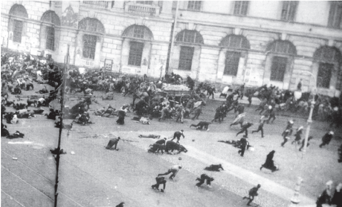
चित्र 10 - जुलाई के दिन.

17 जुलाई 1917 को बोल्शेविक समर्थक प्रदर्शनकारियों पर सेना द्वारा गोलीबारी का दृश्य।