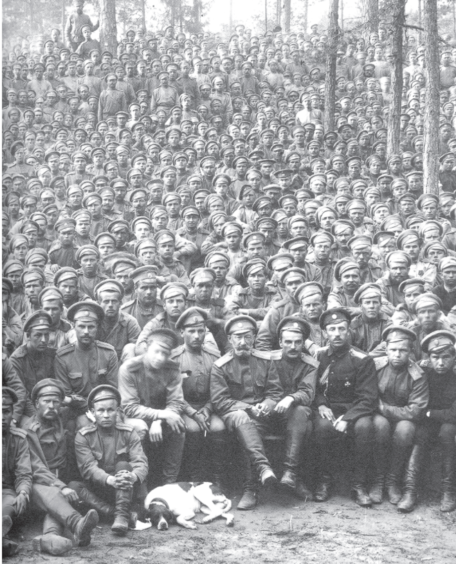
चित्र 7 - पहले विश्वयुद्ध के दौरान रूसी सिपाही . शाही रूसी सेना को 'रूसी स्टीमरोलर' कहा जाता था। यह दुनिया की सबसे बड़ी सशस्त्र सेना थी। जब इस सेना ने अपनी निष्ठा बदल कर क्रांतिकारियों को समर्थन देना शुरू कर दिया तो ज़ार की सत्ता भी ढह गई।

युद्ध से उद्योगों पर भी बुरा असर पड़ा। रूस के अपने उद्योग तो वैसे भी बहुत कम थे, अब तो बाहर से मिलने वाली आपूर्ति भी बंद हो गई क्योंकि बाल्टिक समुद्र में जिस रास्ते से विदेशी औद्योगिक सामान आते थे उस पर जर्मनी का कब्जा हो चुका था। यूरोप के बाकी देशों के मुकाबले रूस के औद्योगिक उपकरण ज़्यादा तेजी से बेकार होने लगे। 1916 तक रेलवे लाइनें टूटने लगीं। अच्छी सेहत वाले मर्दों को युद्ध में झोंक दिया गया। देश भर में मज़दूरों की कमी पड़ने लगी और ज़रूरी सामान बनाने वाली छोटी-छोटी वर्कशॉप्स ठप्प होने लगीं। ज़्यादातर अनाज सैनिकों का पेट भरने के लिए मोर्चे पर भेजा जाने लगा। शहरों में रहने वालों के लिए रोटी और आटे की किल्लत पैदा हो गई। 1916 की सर्दियों में रोटी की दुकानों पर अकसर दंगे होने लगे।