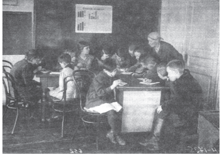
चित्र 15 - तीस के दशक में सोवियत रूस के एक स्कूल में पढ़ते बच्चे। बच्चे सोवियत अर्थव्यवस्था का अध्ययन कर रहे हैं।