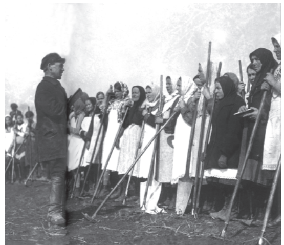
चित्र 19 - विशाल सामूहिक फ़ार्मों में काम करने के लिए जुटी किसान औरतें.

वी. सोकोलोव (सं.), ऑब्ज़ाचेस्त्वो I व्लास्त, वी 1930-ये गोदी।