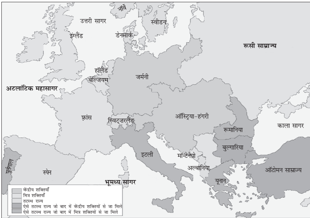
चित्र 4 - 1914 का यूरोप.

मानचित्र में रूसी साम्राज्य और पहले महायुद्ध में शामिल यूरोपीय देशों को दर्शाया गया है।