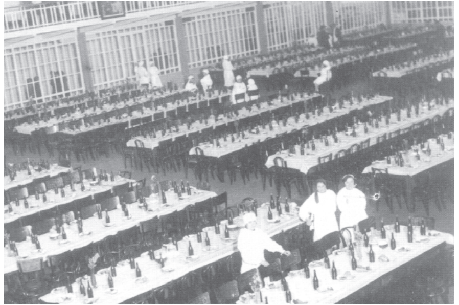
चित्र 17 - तीस के दशक में एक कारखाने का भोजन कक्ष।