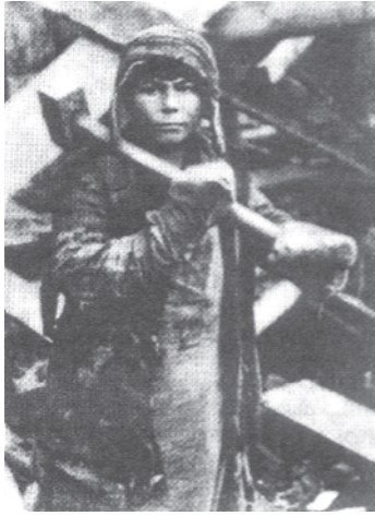
चित्र 16 - पहली पंचवर्षीय योजना के दौरान मैग्नीटोगोर्स्क का एक बच्चा। यह बच्चा सोवियत रूस के लिए काम कर रहा है।