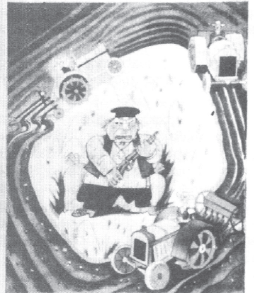
चित्र 18 - सामूहिकीकरण के दौर का एक पोस्टर। इसमें लिखा है : 'हम खेती में कमी लाने वाले कुलक पर वार करेंगे।'