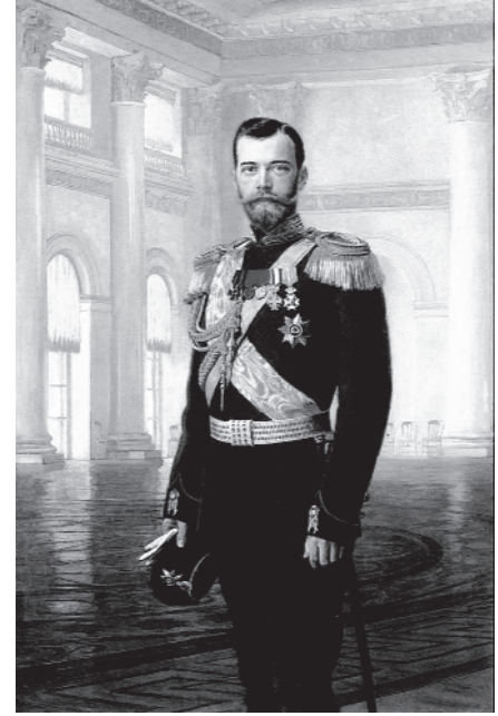
चित्र 3 - सेंट पीटर्सबर्ग स्थित विंटर पैलेस के व्हाइट हॉल में ज़ार निकोलस II, 1900. अर्नेस्ट लिपगार्ट (1847-1932) द्वारा चित्रित।

1914 में रूस और उसके पूरे साम्राज्य पर ज़ार निकोलस II का शासन था। मास्को के आसपास पड़ने वाले भूक्षेत्र के अलावा आज का फ़िनलैंड, लातविया, लिथुआनिया, एस्तोनिया तथा पोलैंड, यूक्रेन व बेलारूस के कुछ हिस्से रूसी साम्राज्य के अंग थे। यह साम्राज्य प्रशांत महासागर तक फैला हुआ था और आज के मध्य एशियाई राज्यों के साथ-साथ जॉर्जिया, आर्मेनिया व अज़रबैजान भी इसी साम्राज्य के अंतर्गत आते थे। रूस में ग्रीक ऑर्थोडॉक्स चर्च से उपजी शाखा रूसी ऑर्थोडॉक्स क्रिश्चियैनिटी को मानने वाले बहुमत