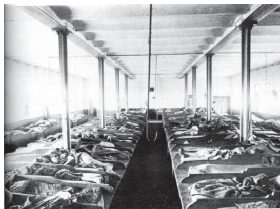
चित्र 6 - क्रांति-पूर्व रूस में एक डॉर्मिटरी में बने बंकर में सोते मजदूर. वे पालियों में बारी-बारी से सोते थे और परिवार को साथ नहीं रख सकते थे।