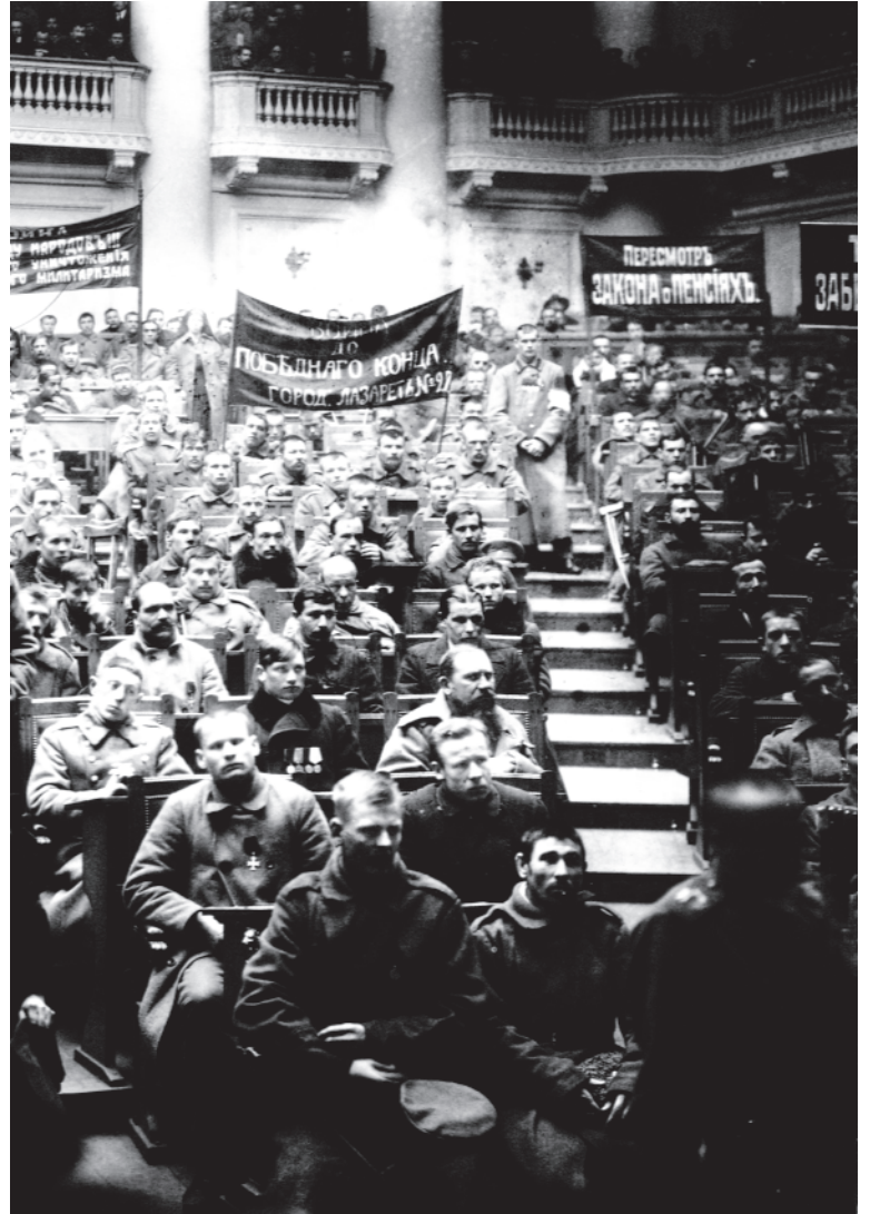
चित्र 8 - ड्यूमा में पेत्रोग्राद सोवियत की बैठक, फरवरी 1917 .

बॉक्स 2 देखें और वर्तमान कैलेंडर के हिसाब से अंतर्राष्ट्रीय महिला दिवस की तिथि का पता लगाएँ।