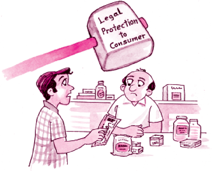
कदाचार एवं शोषण के विरुद्ध संरक्षण

करता है। यह अधिनियम उपभोक्ताओं को दोषपूर्ण वस्तुओं, घटिया स्तर की सेवाओं, अनुचित व्यापार क्रियाओं तथा अन्य प्रकार के शोषण के विरुद्ध सुरक्षा प्रदान करता है। इस अधिनियम के अंतर्गत तीन स्तरीय तंत्र की स्थापना का प्रवधान है जिसमें जिला फोरम, राज्य कमीशन एवं राष्ट्रीय कमीशन सम्मिलित हैं। इसमें प्रत्येक जिला, राज्य एवं सर्वोच्च स्तर पर उपभोक्ता संरक्षण परिषदों के गठन का प्रावधान है।