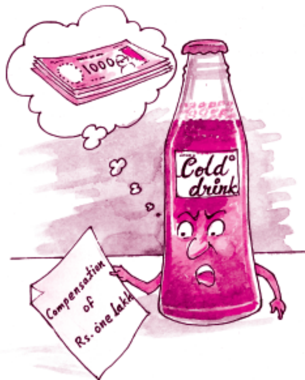
शीतल पेय में अशुद्धता के लिए हर्जाना