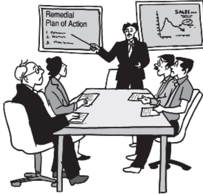
चित्र 8.2—उपचारात्मक कार्ययोजना—विचलन विश्लेषण करना

कारणों को बतलाती है तथा कुछ संबंधित सुधारात्मक कार्यवाही जो प्रबंधकों को करनी चाहिए के विषय में चर्चा करती है—