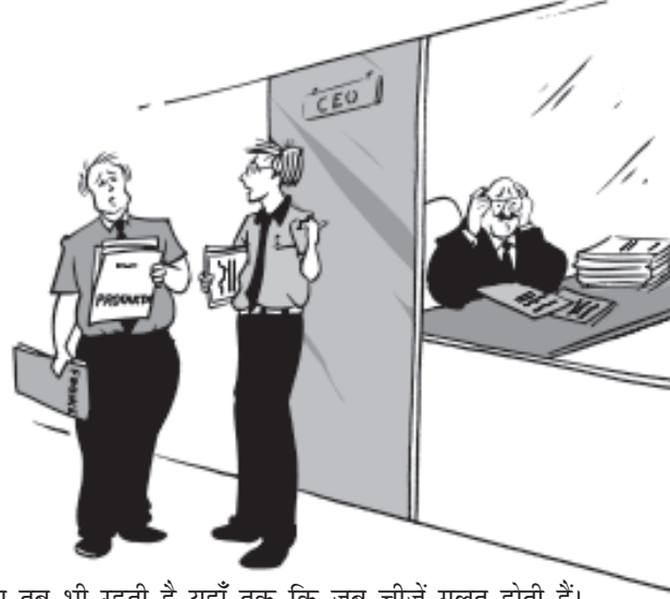
चित्र 8.1—प्रधानता तब भी रहती है यहाँ तक कि जब चीजें गलत होती हैं।

प्रणाली को लागू करने पर क्या इसके ऊपर होने वाला व्यय लाभकारी होगा अथवा नहीं। दूसरे शब्दों में वह आश्चस्त हो कि व्यय-आय से अधिक न हो।