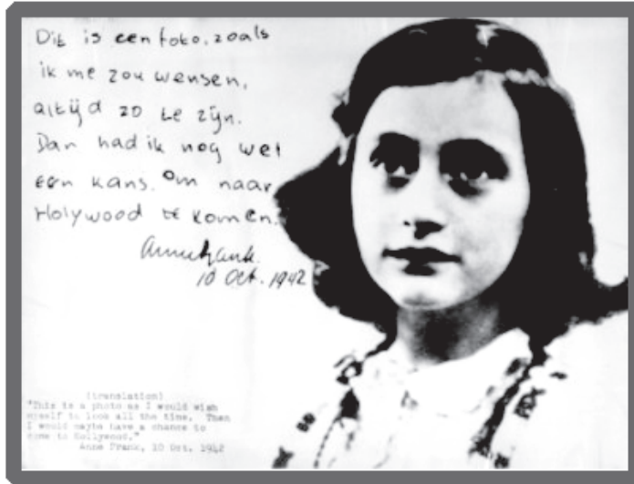
ऐन फ्रैंक की डायरी का एक पन्ना

रात को जब मैं बिस्तर पर होती हूँ तो अपने पापों और बढ़ा-चढ़ाकर बताई गई अपनी खामियों के बारे में सोचती हूँ तो वे इतनी ज़्यादा होती हैं कि अपने मूड के हिसाब से या तो मैं