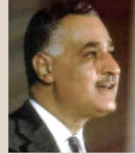
गमाल अब्दुल नासिर (1918-70)

सन् 1970 तक मिस्र के शासक। अरब राष्ट्रवाद, समाजवाद और साम्राज्यवाद-विरोध के लिए प्रतिबद्ध। स्वेज नहर का राष्ट्रीयकरण किया। इसकी वजह से सन् 1956 में अंतर्राष्ट्रीय संघर्ष हुआ।