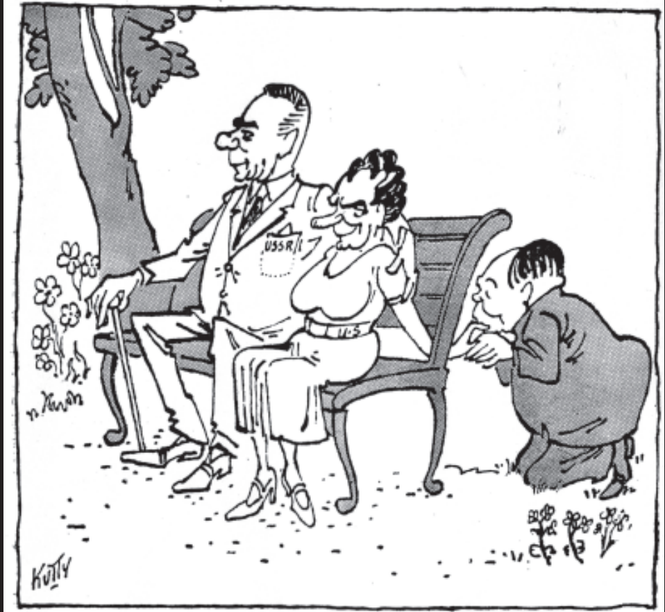
राजनीतिक बसंत - चीन के हाथों में अमरीका का हाथ

ये दोनों कार्टून मशहूर भारतीय कार्टूनिस्ट कुट्टी ने बनाए हैं। इनमें शीतयुद्ध को लेकर भारत के नज़रिए को चित्रित किया गया है। पहला कार्टून उस समय का है जब समाजवादी सोवियत गणराज्य को अंधेरे में रखकर अमरीका ने चीन के साथ गुपचुप दोस्ती गांठी। इस कार्टून में दिखाए गए किरदारों के बारे में और जानकारी जुटाइए। दूसरे कार्टून में वियतनाम में अमरीकी दुस्साहस को चित्रित किया गया है। वियतनाम-युद्ध के बारे में और जानकारी जुटाएँ।