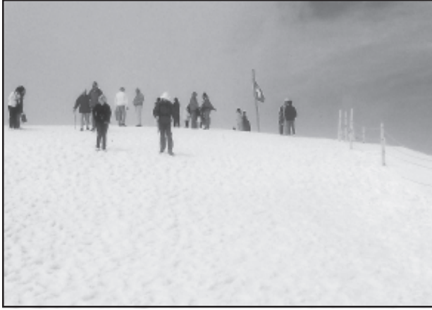
चित्र 7.5 : स्विट्जरलैंड में बर्फ से ढकी पर्वत चोटी पर स्कींग करते पर्यटक

पर्यटन एक यात्रा है जो व्यापार की बजाय प्रमोद के उद्देश्यों के लिए की जाती है। कुल पंजीकृत रोजगारों तथा कुल राजस्व (सकल घरेलू उत्पाद का 40 प्रतिशत) की दृष्टि से यह विश्व का अकेला सबसे बड़ा (25 करोड़) तृतीयक क्रियाकलाप बन गया है। इनके अतिरिक्त पर्यटकों के आवास, भोजन, परिवहन, मनोरंजन तथा विशेष दुकानों जैसी सेवा उपलब्ध कराने के लिए अनेक स्थानीय व्यक्तियों को नियुक्त किया जाता है। पर्यटन अवसंरचना उद्योगों, फुटकर व्यापार तथा शिल्प उद्योगों (स्मारिका) को पोषित करता है। कुछ प्रदेशों में पर्यटन ऋतुनिष्ठ होता है क्योंकि अवकाश की अवधि अनुकूल मौसमी दशाओं पर निर्भर करती है, किंतु कई प्रदेश वर्षपर्यंत पर्यटकों को आकर्षित करते हैं।