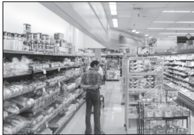
चित्र 7.3 : अमेरिका में डिब्बाबंद आहार बाजार

नगरीय बाजार केंद्रों में और अधिक विशिष्टीकृत नगरीय सेवाएँ मिलती हैं। इनमें न केवल साधारण वस्तुएँ और सेवाएँ बल्कि लोगों द्वारा वांछित अनेक विशिष्ट वस्तुएँ व सेवाएँ भी उपलब्ध होती हैं। नगरीय केंद्र, इसलिए विनिर्मित पदार्थों के साथ-साथ विशिष्टीकृत बाजार भी प्रस्तुत करते हैं जैसे श्रम बाजार, आवासन, अर्ध-निर्मित एवं निर्मित उत्पादों का बाजार। इनमें शैक्षिक संस्थाओं और व्यावसायिकों की सेवाएँ जैसे— अध्यापक, वकील, परामर्शदाता, चिकित्सक, दाँतों का डॉक्टर और पशु चिकित्सक आदि उपलब्ध होते हैं।