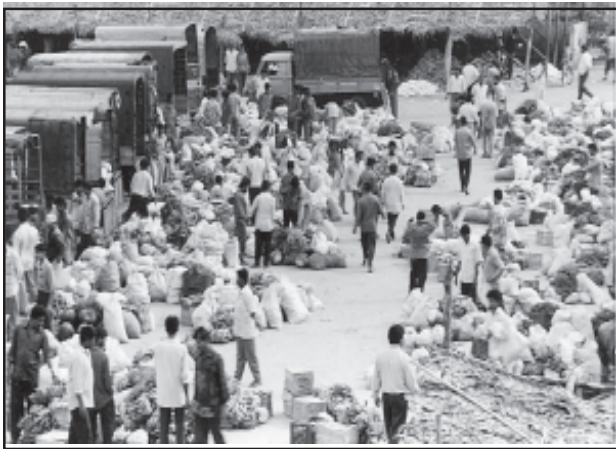
चित्र 7.2 : सब्जियों का थोक बाजार

ग्रामीण विपणन केंद्र निकटवर्ती बस्तियों का पोषण करते हैं। ये अर्ध-नगरीय केंद्र होते हैं। ये अत्यंत अल्पवर्धित प्रकार के व्यापारिक केंद्रों के रूप में सेवा करते हैं। यहाँ व्यक्तिगत और व्यावसायिक सेवाएँ सुविकसित नहीं होतीं। ये स्थानीय संग्रहण और वितरण केंद्र होते हैं। इनमें से अधिकांश केंद्रों में मंडियाँ (थोक बाजार) और फुटकर व्यापार क्षेत्र भी होते हैं। ये स्वयं में नगरीय केंद्र नहीं हैं किंतु ग्रामीण लोगों की अधिक माँग वाली वस्तुओं और सेवाओं को उपलब्ध कराने वाले महत्त्वपूर्ण केंद्र हैं।