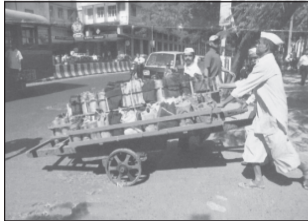
चित्र 7.4 : मुंबई में डब्बावाला सेवा

दैनिक जीवन में काम को सुविधाजनक बनाने के लिए लोगों को व्यक्तिगत सेवाएँ उपलब्ध कराई जाती हैं। कामगार रोजगार की तलाश में ग्रामीण क्षेत्रों से प्रवास करते हैं और अकुशल होते हैं। वे मोची, गृहपाल, खानसामा और माली जैसी घरेलू सेवाओं के लिए नियुक्त किए जाते हैं और इन्हें कम भुगतान किया जाता है। कर्मियों का यह वर्ग असंगठित है। ऐसा एक उदाहरण मुंबई की डब्बावाला सेवा है जो पूरे नगर में लगभग 1,75,000 उपभोक्ताओं को उपलब्ध कराई जाती है।