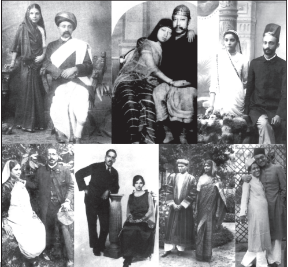
1880 से 1930 के दौरान विभिन्न क्षेत्रों के दंपती: सबसे ऊपर बाएँ कोने से: गुजरात; त्रिपुरा; मुंबई; अलीगढ़; हैदराबाद; गोवा; कोलकाता।

क्षेत्रीय भावनाओं को आदर देना मात्र ही राज्य निर्माण के लिए काफ़ी नहीं है, बल्कि इसके लिए एक ऐसा संस्थागत ढाँचा होना भी जरूरी है जो यह सुनिश्चित कर सके कि वह एक बड़े संघीय ढाँचे के