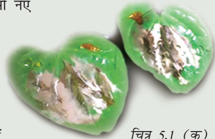
चित्र 5.1 (क) पान के पत्ते

इस अध्याय में हम यह देखेंगे कि उपमहाद्वीप में आए यात्रियों द्वारा दिए गए सामाजिक जीवन के विवरणों के अध्ययन से किस प्रकार हम अपने अतीत के विषय में ज्ञान बढ़ा सकते हैं। इसके लिए हम तीन व्यक्तियों के वृत्तांतों पर ध्यान देंगे: अल-बिरूनी, जो ग्यारहवीं शताब्दी में उज्बेकिस्तान आया था, इब्न बतूता (चौदहवीं शताब्दी), मोरक्को से तथा फ्रांसीसी यात्री फ्रांस्वा बर्नियर (सत्रहवीं शताब्दी)।