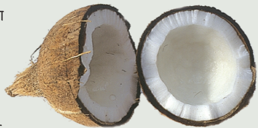
चित्र 5.1 (ख) नारियल

कई यात्रियों ने नारियल तथा पान जैसी चीजों को असामान्य माना।