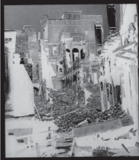
चित्र 15.2 विनाश और उथल-पुथल की छवियाँ संविधान सभा के सदस्यों को लंबे समय तक परेशान करती रहीं।

राजनीति शास्त्र की पाठ्यपुस्तकों को पढ़ने के बाद आप यह जान चुके होंगे कि भारत का संविधान कैसा है। आप देख चुके हैं कि आजादी के बाद इस संविधान की क्या उपयोगिता और सार्थकता रही है। इस अध्याय में हम संविधान के इतिहास और उसके निर्माण के दौरान हुई गहन परिचर्चा को जानेंगे। यदि संविधान सभा में उठने वाली आवाजों को सुनने का प्रयास करें तो हमें उन प्रक्रियाओं का अंदाज़ा लग जाएगा जिनके माध्यम से संविधान को सूत्रबद्ध किया गया और एक नए राष्ट्र की कल्पना साकार हुई।