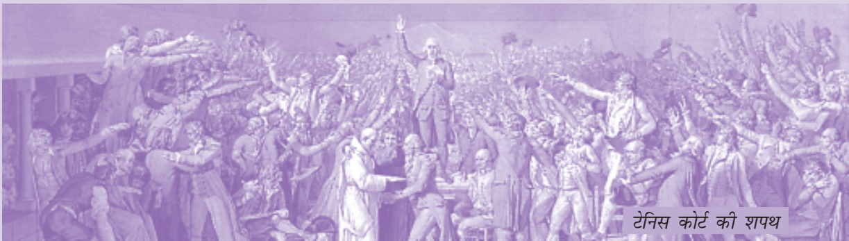
टेनिस कोर्ट की शपथ