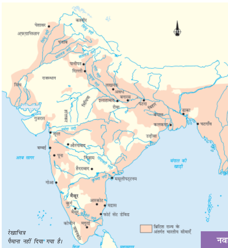
मानचित्र 1 1857 में भारतीय उपमहाद्वीप।