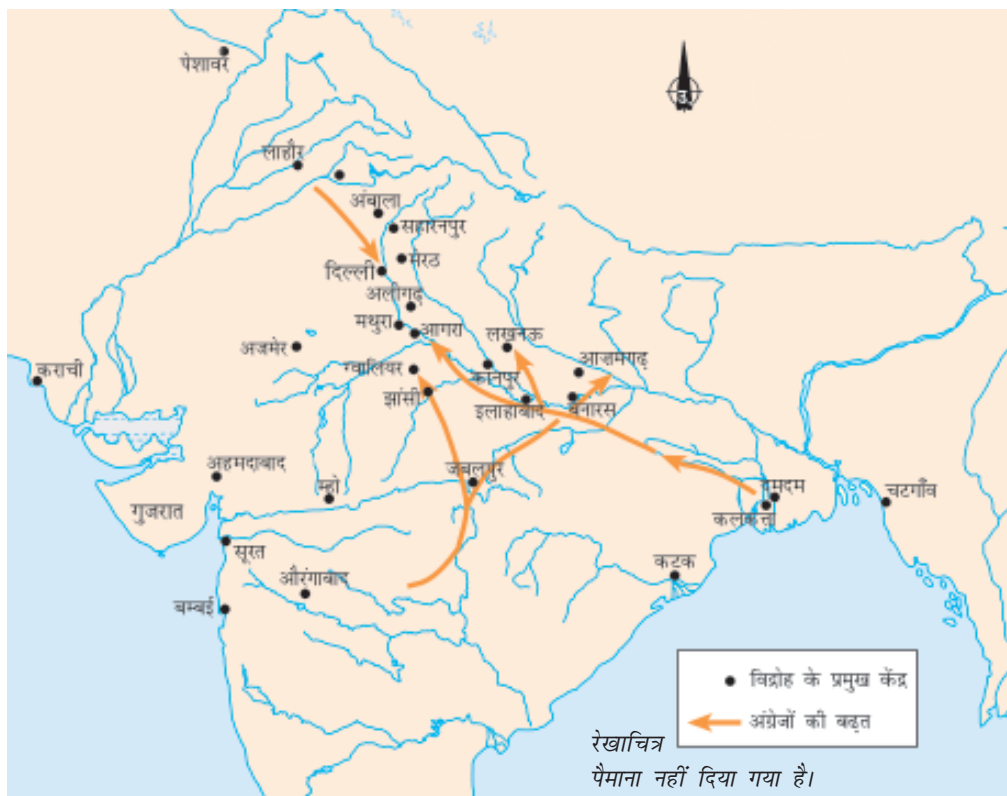
रेखाचित्र पैमाना नहीं दिया गया है।

☞ इस विवरण के अनुसार गाँव वालों से निपटने में अंग्रेजों को किन मुश्किलों का सामना करना पड़ा?