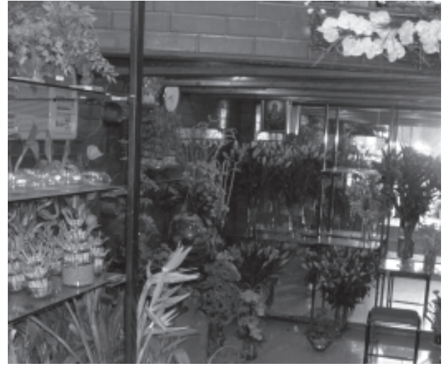
फूलों की खेती

बीजों तथा कृषि कार्य हेतु जानकारी का एकमात्र स्रोत होते हैं, और निःसंदेह वे अपने उत्पाद बेचने के इच्छुक होते हैं। इससे किसानों की महँगी खाद और कीटनाशकों पर निर्भरता बढ़ी है, जिससे उनका लाभ कम हुआ है, बहुत से किसान ऋणी हो गए हैं, तथा ग्रामीण क्षेत्रों में पर्यावरण संकट भी पैदा हुआ है।