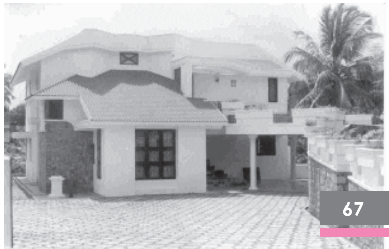
इस घर को देखिए। यह सुकुतम केरल के एक गाँव चक्कार में है यह पालघाट कस्बे से जो कि जिले से 3 किमी. की दूरी पर है।

इस प्रकार त्वरित कृषि विकास वाले क्षेत्रों में पुराने भूमि अथवा कृषि समूह का समेकन हुआ, जिन्होंने स्वयं को एक गतिमान उद्यमी, ग्रामीण नगरीय प्रबल वर्ग के रूप में परिवर्तित कर लिया। लेकिन अन्य क्षेत्रों जैसे पूर्वी उत्तर प्रदेश तथा बिहार में प्रभावशाली भू-सुधारों का अभाव, राजनीतिक गतिशीलता तथा पुनर्वितरण के साधनों के कारण वहाँ तुलनात्मक रूप से कृषिक संरचना तथा अधिकांश लोगों की जीवन दशाओं में थोड़े बदलाव हुए। इसके विपरीत केरल जैसे राज्य विकास की एक भिन्न प्रक्रिया से गुजरे जिसमें राजनीतिक गतिशीलता, पुनर्वितरण के साधन तथा बाह्य अर्थव्यवस्था (मूल रूप से खाड़ी के देश) से जुड़ाव ने ग्रामीण परिवेश में भरपूर बदलाव किया। केरल में ग्रामीण क्षेत्र मूल रूप से कृषि प्रधान होने के बजाए मिश्रित अर्थव्यवस्था वाला है जिनमें कुछ कृषि कार्य खुदरा विक्रय तथा सेवाओं के एक विस्तृत संजाल के साथ जुड़ा हुआ है, और जहाँ एक बड़ी संख्या में परिवार विदेश से भेजे जाने वाले धन पर निर्भर हैं।