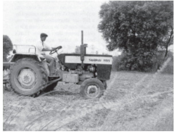
कृषि व्यवस्था में बदलती हुई तकनीकें

तथा राजनीतिक रूप से प्रबल हो गए। (स्टूटन, 1995) वर्ग संरचना के इस परिवर्तन के साथ ही ग्रामीण तथा अर्द्ध-नगरीय क्षेत्रों में उच्च शिक्षा का विस्तार, विशेषतः निजी व्यावसायिक महाविद्यालयों की स्थापना से नव ग्रामीण अभिजात वर्ग द्वारा अपने बच्चों को शिक्षित करना संभव हुआ, जिनमें से बहुतों ने व्यावसायिक अथवा श्वेत वस्त्र व्यवसाय अपनाए अथवा व्यापार प्रारंभ कर नगरीय मध्य वर्गों के विस्तार में योगदान दिया।