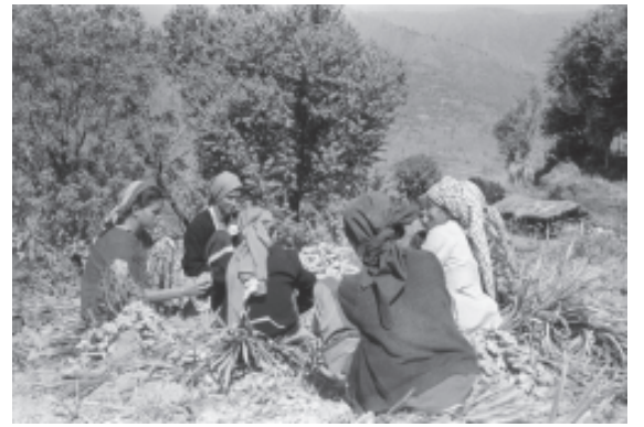
देश के विभिन्न भागों में कृषि कार्य

1960 व 1970 के दशक में कृषि विकास द्वारा ग्रामीण सामाजिक संरचना को बदलने वाला एक तरीका नयी तकनीक अपनाने वाले मध्यम तथा बड़े किसानों की समृद्धि थी, जिसकी चर्चा पूर्व भाग में की गई है। अनेक कृषि संपन्न क्षेत्रों जैसे तटीय आंध्रप्रदेश, पश्चिमी उत्तर प्रदेश तथा मध्य गुजरात में प्रबल जातियों के संपन्न किसानों ने कृषि से होने वाले लाभ को अन्य प्रकार के व्यापारों में निवेश करना प्रारंभ कर दिया। विविधता की इस प्रक्रिया से नए उद्यमी समूहों का उदय हुआ जिन्होंने ग्रामीण क्षेत्रों से इन विकासशील क्षेत्रों के बढ़ते कस्बों की ओर पलायन किया, जिससे नए क्षेत्रीय अभिजात वर्गों का उदय हुआ जो आर्थिक