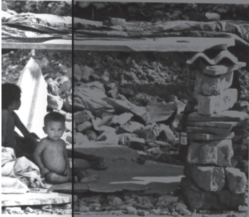
in their demolished house, in New Delhi on July 31.

tries and State these funds must invariably certifying the dates be transferred to panchayats amounts of local gran