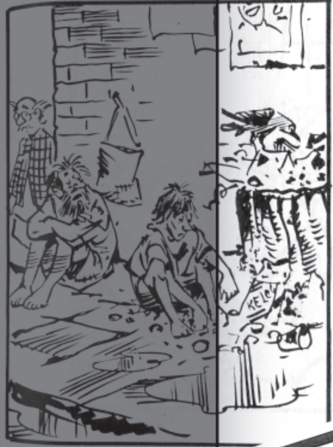
Be careful about what you eat... of poisoning around

s tion was a major media affair. And their elegant paintings and curtains