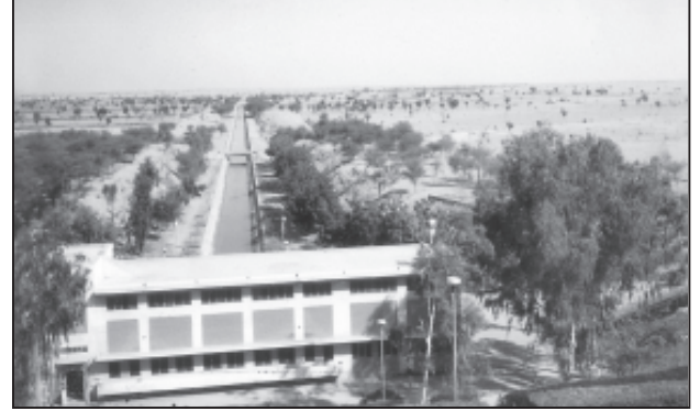
चित्र 9.5 : इंदिरा गांधी नहर और उसके समीपस्थ क्षेत्र

फैला हुआ है। इसमें स्थानांतरित बालू टिब्बों वाला मरुस्थल भी सम्मिलित है; जहाँ स्थानांतरी बालू टिब्बे पाए जाते हैं और ग्रीष्म ऋतु में तापमान 50° सेल्सियस तक पहुँच जाता है। लिफ्ट नहर में ढाल के विपरीत प्रवाह के लिए जल को बार-बार मशीनों से ऊपर उठाया जाता है। इंदिरा गांधी नहर तंत्र में सभी लिफ्ट नहरें मुख्य नहर के बाएँ किनारे से निकलती हैं जबकि मुख्य नहर के दाएँ किनारे पर सभी नहरें प्रवाह प्रणाल हैं।