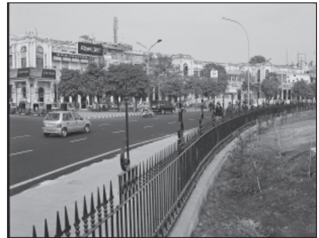
चित्र 4.4 : आधुनिक शहर का एक दृश्य

अंग्रेजों और अन्य यूरोपियों ने भारत में अनेक नगरों का विकास किया। तटीय स्थानों पर अपने पैर जमाते हुए उन्होंने सर्वप्रथम सूरत, दमन, गोआ, पांडिचेरी इत्यादि जैसे व्यापारिक पत्तन