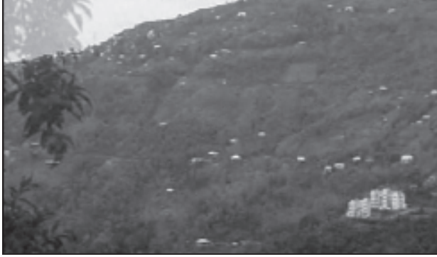
चित्र 4.3 : नागालैंड में परिक्षिप्त बस्तियाँ

भारत में परिक्षिप्त अथवा एकाकी बस्ती प्रारूप सुदूर जंगलों में एकाकी झोंपड़ियों अथवा कुछ झोंपड़ियों की पल्ली अथवा छोटी पहाड़ियों की ढालों पर खेतों अथवा चरागाहों के रूप में दिखाई पड़ता है। बस्ती का चरम विक्षेपण प्रायः भू-भाग और