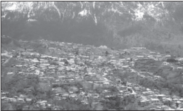
चित्र 4.1 : उत्तर-पूर्वी राज्यों में गुच्छित बस्तियाँ

गुच्छित ग्रामीण बस्ती घरों का एक संहत अथवा संकुलित रूप से निर्मित क्षेत्र होता है। इस प्रकार के गाँव में रहन-सहन का सामान्य क्षेत्र स्पष्ट और चारों ओर फैले खेतों, खलिहानों और चरागाहों से पृथक होता है। संकुलित निर्मित क्षेत्र और इसकी मध्यवर्ती गलियाँ कुछ जाने-पहचाने प्रारूप अथवा ज्यामितीय आकृतियाँ प्रस्तुत करते हैं जैसे कि आयताकार, अरीय, रैखिक इत्यादि। ऐसी बस्तियाँ प्रायः उपजाऊ जलोढ़ मैदानों और उत्तर-पूर्वी राज्यों में पाई जाती हैं। कई बार लोग सुरक्षा अथवा प्रतिरक्षा कारणों से संहत गाँवों में रहते हैं, जैसे कि मध्य भारत