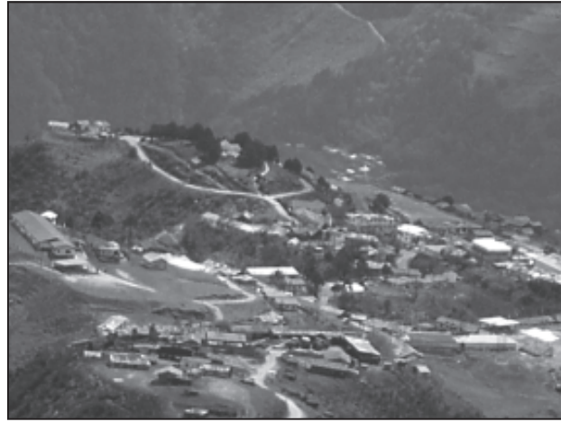
चित्र 4.2 : अर्ध-गुच्छित बस्तियाँ

अर्ध-गुच्छित अथवा विखंडित बस्तियाँ परिक्षिप्त बस्ती के किसी सीमित क्षेत्र में गुच्छित होने की प्रवृत्ति का परिणाम है। अधिकतर ऐसा प्रारूप किसी बड़े संहत गाँव के संपृथकन अथवा विखंडन के परिणामस्वरूप भी उत्पन्न हो सकता है। ऐसी स्थिति में ग्रामीण समाज के एक अथवा अधिक वर्ग स्वेच्छा से अथवा बलपूर्वक मुख्य गुच्छ अथवा गाँव से थोड़ी दूरी पर रहने लगते हैं। ऐसी स्थितियों में, आमतौर पर ज़मींदार और अन्य प्रमुख समुदाय मुख्य गाँव के केंद्रीय भाग पर