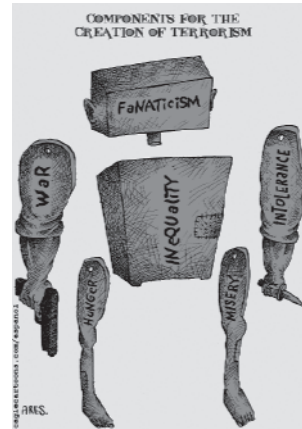
आतंकवाद के जन्म के कारण

संयुक्त राष्ट्र शैक्षणिक, वैज्ञानिक एवं सांस्कृतिक संगठन (यूनिसेफ) के संविधान ने उचित ही टिप्पणी की है कि, "चूँकि युद्ध का आरंभ