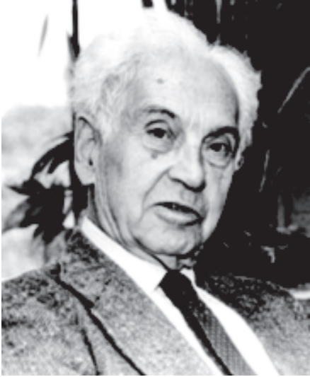
एरनस्ट मेयर (1904 - 2004)

एरनस्ट मेयर का जन्म 5 जुलाई, 1904 में केंपटन, जर्मनी में हुआ था। आप हावर्ड विश्वविद्यालय के विकासपरक जीव वैज्ञानिक थे, जिन्हें '20वीं शती का डार्विन' कहा गया। आप अब तक के 100 महान वैज्ञानिकों में से एक थे। मेयर ने सन् 1953 में हावर्ड विश्वविद्यालय की कला एवं विज्ञान संकाय में नौकरी प्राप्त की और 1975 में एलेक्जेंडर अगासीज प्रोफ़ेसर ऑफ़ जुलोजी एमीरिटस की पदवी के साथ अवकाश प्राप्त किया। अपने 80 सालों के कार्य जीवन में आपका पक्षी-विज्ञान, वर्गीकरण-विज्ञान, प्राणि-भूगोल, विकास, वर्गिकी तथा जीव विज्ञान के इतिहास एवं दर्शन आदि पर अनुसंधान केंद्रित रहा। आप ने लगभग अकेले ही विकासीय जीव विज्ञान के केंद्रीय प्रश्न जाति विविधता की उत्पत्ति को खड़ा किया, जो कि आज सच है। इसके साथ ही आपने हाल ही में स्वीकृत जीव वैज्ञानिक जाति वर्गिकी की परिभाषा की अगुवाई की। मेयर को तीन पुरस्कार दिए गए, जिन्हें व्यापक तौर पर जीव विज्ञान के तीन ताजों की संज्ञा दी जाती है: 1983 में बालजॉन प्राइज, 1998 में जीव विज्ञान के लिए इंटरनेशनल प्राइज और 1999 में क्राफ़र्ड प्राइज। मेयर ने 100 वर्ष की आयु में 2004 को स्वर्गवासी हुए।