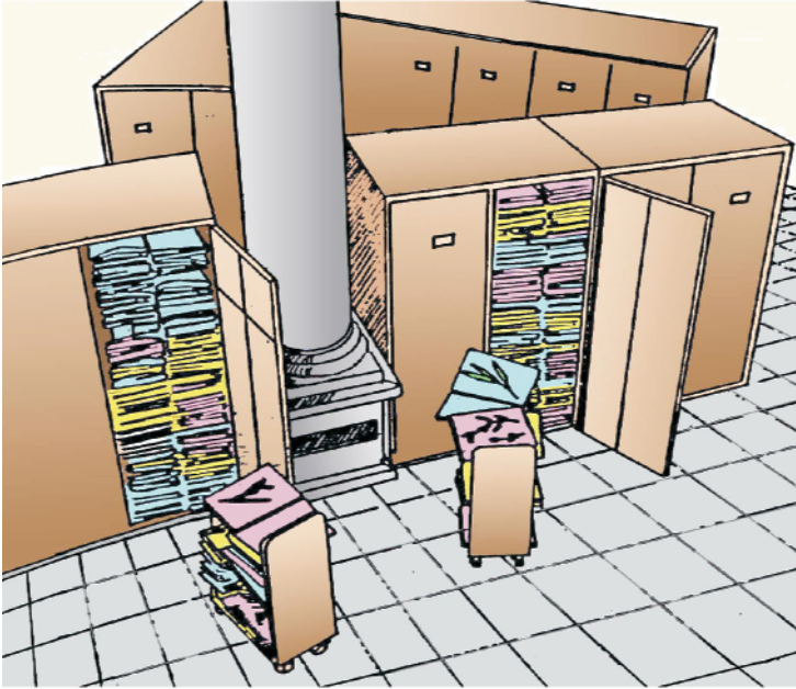
चित्र 1.2 वनस्पति संग्रहालय में पौधों के एकत्रित नमूने