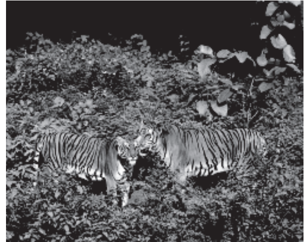
चित्र 1.3 भारत के विभिन्न चिड़ियाघरों में वन्य प्राणी