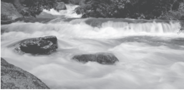
चित्र 3.3 : क्षिप्रिकाएँ

समतल घाटियों, गोखुर झीलें, बाढ़कृत मैदान, गुंफित वाहिकाएँ और नदी के मुहाने पर डेल्टा का निर्माण करती हैं। हिमालय क्षेत्र में इन नदियों का रास्ता टेढ़ा-मेढ़ा है, परंतु मैदानी क्षेत्र में इनमें सर्पाकार मार्ग में बहने की प्रवृत्ति पाई जाती है और अपना रास्ता बदलती रहती हैं। कोसी नदी, जिसे बिहार का शोक (Sorrow of Bihar) कहते हैं, अपना मार्ग बदलने के लिए कुख्यात रही है। यह नदी पर्वतों के ऊपरी क्षेत्रों से भारी मात्रा में अवसाद लाकर मैदानी भाग में जमा करती है। इससे नदी मार्ग अवरूद्ध हो जाता है व परिणामस्वरूप नदी अपना मार्ग बदल लेती है। कोसी नदी ऊपरी पर्वतीय क्षेत्र से इतनी भारी मात्रा में अवसाद क्यों लाती है? क्या आप सोचते हैं कि सामान्यतः नदियों में और विशेष तौर पर कोसी नदी में जल का बहाव व मात्रा एक समान रहती है या घटती-बढ़ती रहती है? नदी में कब जल की मात्रा अत्यधिक होती है? बाढ़ के सकारात्मक व नकारात्मक प्रभाव क्या हैं?