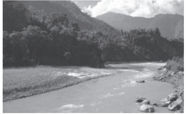
चित्र 3.1 : पर्वतीय क्षेत्र की एक नदी

दिशा से दूसरी दिशा में बहने का कारण बता सकते हैं? उत्तर में हिमालय तथा दक्षिण में पश्चिमी घाट