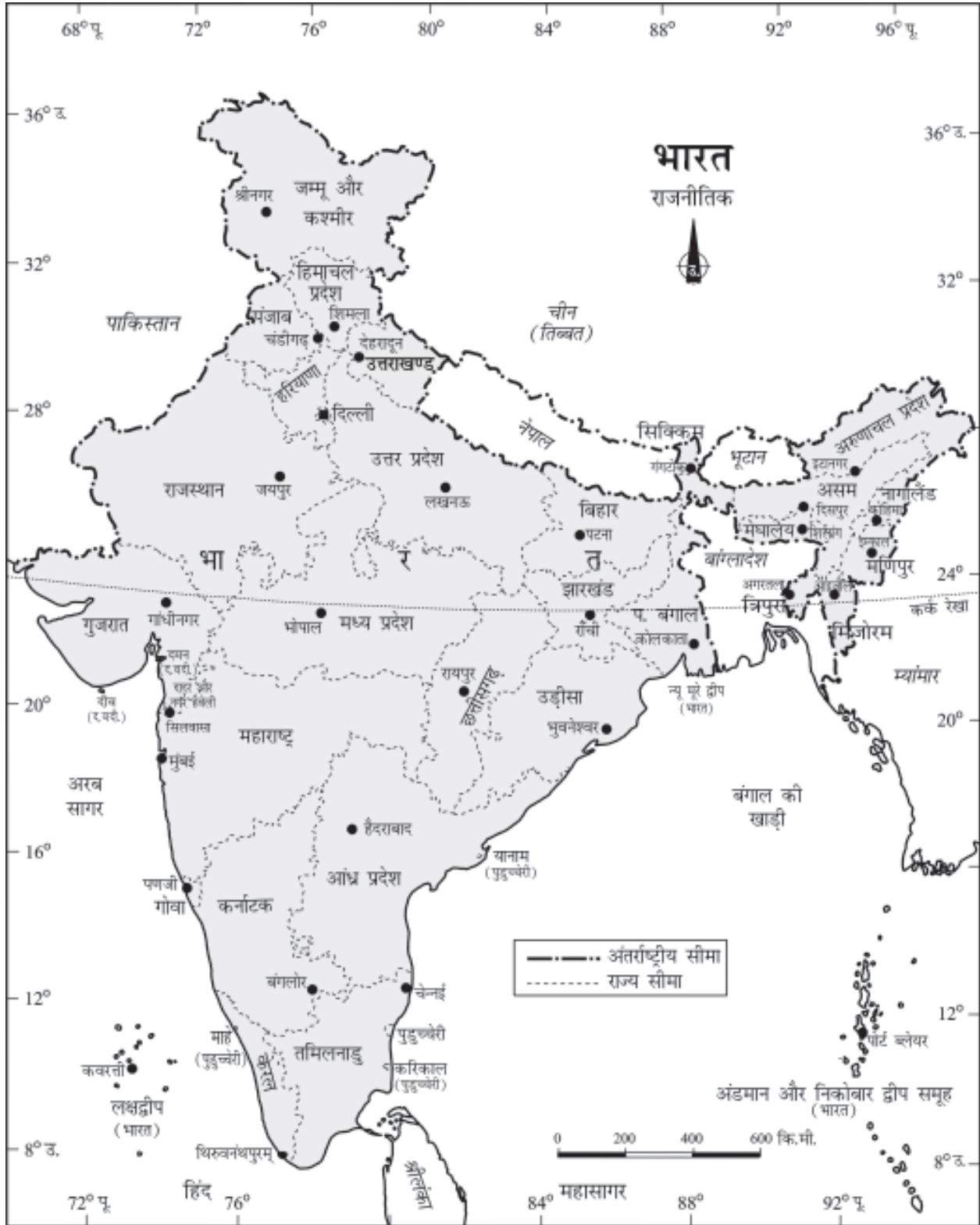
चित्र 1.1 : भारत : राजनीतिक