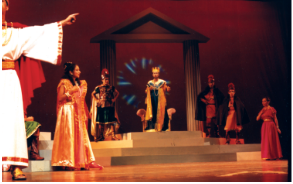
पारसी थिएटर शैली में खेले गए नाटक का दृश्य