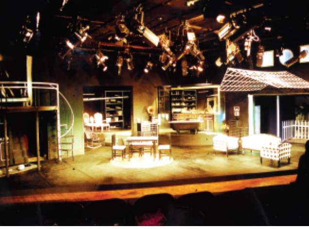
आधुनिक नाटक की एक रंगमंच सज्जा