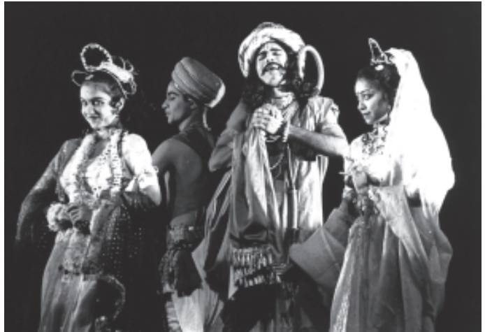
शास्त्रीय शैली में खेले गए नाटक का एक दृश्य