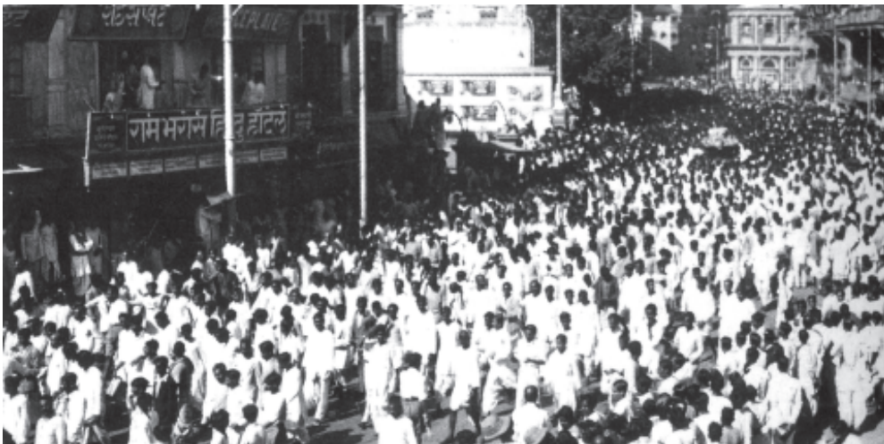
चित्र 1 - 6 अप्रैल 1919 राष्ट्रीय आंदोलन के दौरान सड़कों पर इस तरह के बड़े जुलूस आम बात थी।

पहले की एक और पुस्तक में भी आपने भारत में राष्ट्रवाद के उदय का अध्ययन किया था। वहाँ आपने बीसवीं सदी के पहले दशक तक की कहानी पढ़ी थी। इस अध्याय में हम 1920 के दशक से आगे अध्ययन करेंगे और असहयोग आंदोलन तथा सविनय अवज्ञा आंदोलन के बारे में पढ़ेंगे। हम ये देखेंगे कि कांग्रेस ने राष्ट्रीय आंदोलन को विकसित करने के लिए किस तरह के प्रयास किए, इस आंदोलन में विभिन्न सामाजिक समूहों ने किस तरह हिस्सा लिया और किस तरह राष्ट्रवाद ने लोगों की कल्पना को नयी उड़ान दे दी।