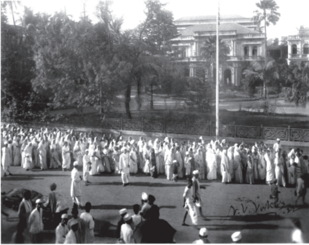
चित्र 9 - राष्ट्रवादी जुलूसों में औरतें भी शामिल थीं।

राष्ट्रीय आंदोलन के दौरान बहुत सारी औरतें अपनी जिंदगी में पहली बार अपने घर से निकलकर सार्वजनिक क्षेत्र में आई थीं। इस चित्र में आप बच्चों को गोद में लिए बहुत सारी ज्यादा उम्र वाली औरतों और माँओं को भी जुलूस में देख सकते हैं।