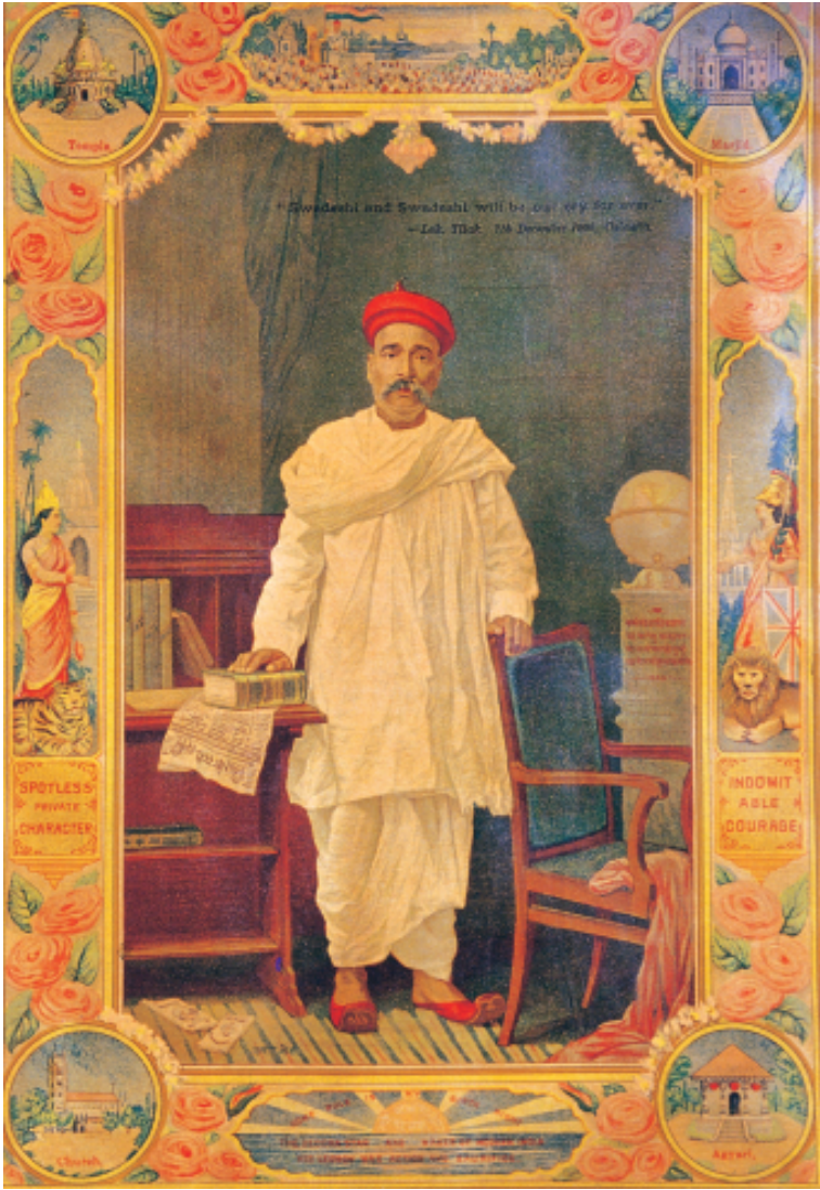
चित्र 11 - बालगंगाधर तिलक, बीसवीं सदी के शुरू की तसवीर।

ध्यान से देखें कि तिलक एकता के प्रतीकों से घिरे हुए हैं। चित्र के चारों ओर विभिन्न धर्मों के पवित्र स्थान (मंदिर, चर्च, मस्जिद) चित्रित किए गए हैं।