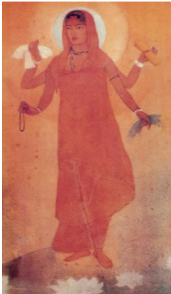
चित्र 12 - भारत माता, अबनीन्द्रनाथ टैगोर, 1905

राष्ट्रवाद का विचार भारतीय लोक कथाओं को पुनर्जीवित करने के आंदोलन से भी मज़बूत हुआ। उन्नीसवीं सदी के आखिर में राष्ट्रवादियों ने भाटों व चारणों द्वारा गाई-सुनाई जाने वाली लोक कथाओं को दर्ज करना शुरू कर दिया। वे लोक गीतों व जनश्रुतियों को इकट्ठा करने के लिए गाँव-गाँव घूमने लगे। उनका मानना था कि यही कहानियाँ हमारी उस परंपरागत संस्कृति की सही तसवीर पेश करती हैं जो बाहरी ताकतों के प्रभाव से भ्रष्ट और दूषित हो चुकी है। अपनी राष्ट्रीय पहचान को ढूँढ़ने और अपने अतीत में गौरव का भाव पैदा करने के लिए इस लोक परंपरा को बचाकर रखना जरूरी था। बंगाल में खुद रबीन्द्रनाथ टैगोर भी लोक-गाथा गीत, बाल गीत और मिथकों