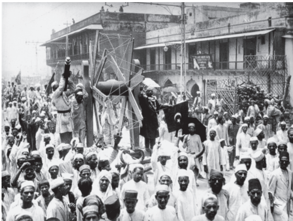
चित्र 4 - विदेशी कपड़े का बहिष्कार, जुलाई 1922 विदेशी कपड़ों को पश्चिमी आर्थिक एवं सांस्कृतिक प्रभुत्व का प्रतीक माना जाता था।

बहिष्कार : किसी के साथ संपर्क रखने और जुड़ने से इनकार करना या गतिविधियों में हिस्सेदारी, चीजों की खरीद व इस्तेमाल से इनकार करना। आमतौर पर यह विरोध का एक रूप होता है।