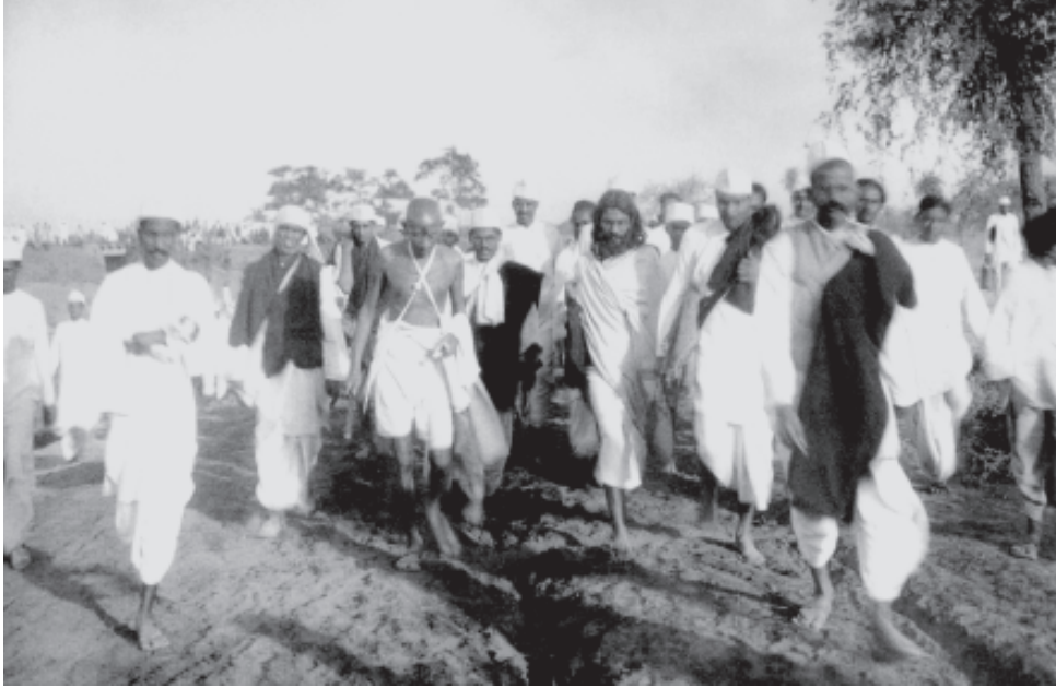
चित्र 7 - दांडी मार्च।

नमक यात्रा के दौरान महात्मा गांधी के साथ उनके 78 सहयोगी भी गए थे। रास्ते में हजारों लोग इस यात्रा में जुड़ते गए।