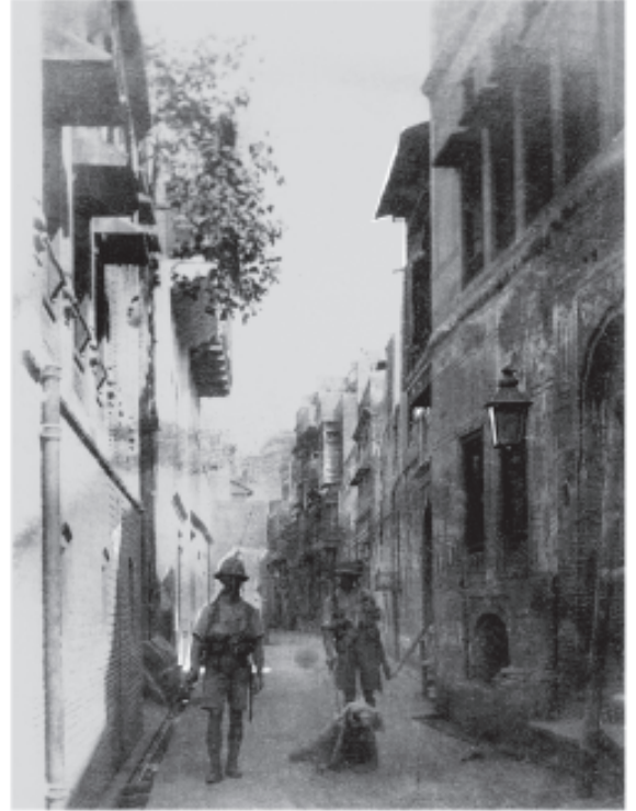
चित्र 3 - जनरल डायर के हुक्म से सिपाही लोगों को घिसट कर चलने के लिए मजबूर कर रहे हैं, पंजाब, 1919

अपनी प्रसिद्ध पुस्तक हिंद स्वराज (1909) में महात्मा गांधी ने कहा था कि भारत में ब्रिटिश शासन भारतीयों के सहयोग से ही स्थापित हुआ था और यह शासन इसी सहयोग के कारण चल पा रहा है। अगर भारत के लोग अपना सहयोग वापस ले लें तो साल भर के भीतर ब्रिटिश शासन ढह जाएगा और स्वराज की स्थापना हो जाएगी।