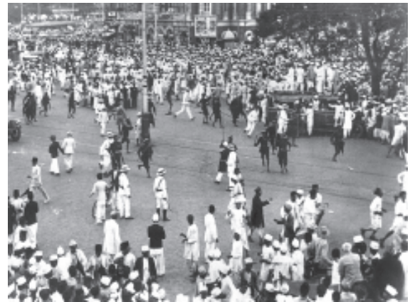
चित्र 8 - सत्याग्रहियों पर हमला करती पुलिस, 1930

महात्मा गांधी ने एक बार फिर आंदोलन वापस ले लिया। 5 मार्च 1931 को उन्होंने इरविन के साथ एक समझौते पर दस्तखत कर दिए। इस गांधी-इरविन समझौते के ज़रिए गांधीजी ने लंदन में होने वाले दूसरे गोलमेज़ सम्मेलन में हिस्सा लेने पर अपनी सहमति व्यक्त कर दी (पहले