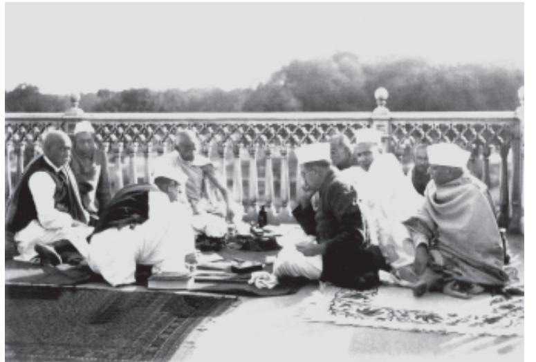
चित्र 6 - इलाहाबाद में कांग्रेस के नेताओं की बैठक, 1931

1928 में जब साइमन कमीशन भारत पहुँचा तो उसका स्वागत 'साइमन कमीशन वापस जाओ' (साइमन कमीशन गो बैक) के नारों से किया गया। कांग्रेस और मुस्लिम लीग, सभी पार्टियों ने प्रदर्शनों में हिस्सा लिया। इस विरोध को शांत करने के लिए वायसराय लॉर्ड इरविन ने अक्टूबर 1929 में भारत के लिए 'डोमीनियन स्टेटस' का गोलमोल सा ऐलान कर दिया। उन्होंने इस बारे में कोई समय सीमा भी नहीं बताई। उन्होंने सिर्फ़ इतना कहा कि भावी संविधान के बारे में चर्चा करने के लिए गोलमेज़ सम्मेलन आयोजित किया जाएगा। इस प्रस्ताव से कांग्रेस के नेता संतुष्ट नहीं थे। जवाहरलाल नेहरू और सुभाषचंद्र बोस के नेतृत्व में कांग्रेस का तेज़-तर्रार खेमा आक्रामक तेवर अपनाने लगा था। उदारवादी और