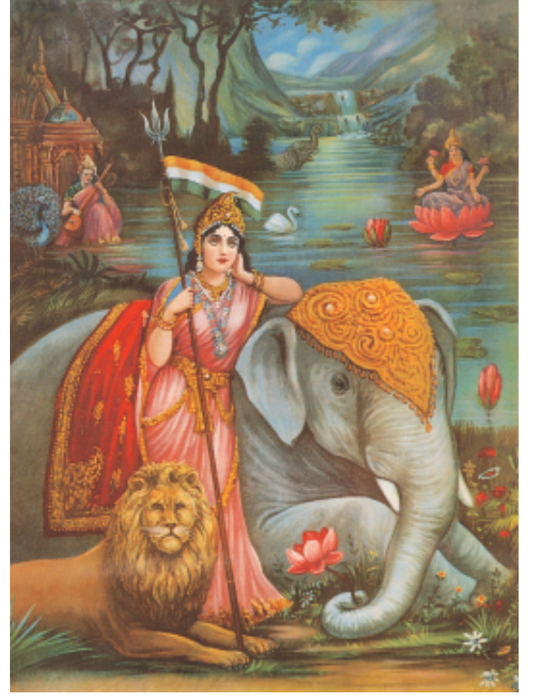
चित्र 14 - भारत माता।

इतिहास की पुनर्व्याख्या राष्ट्रवाद की भावना पैदा करने का एक और साधन थी। उन्नीसवीं सदी के अंत तक आते-आते बहुत सारे भारतीय यह महसूस करने लगे थे कि राष्ट्र के प्रति गर्व का भाव जगाने के लिए भारतीय इतिहास को अलग ढंग से पढ़ाया जाना चाहिए। अंग्रेजों की नज़र में भारतीय पिछड़े हुए और आदिम लोग थे जो अपना शासन खुद नहीं सँभाल सकते। इसके जवाब में भारत के लोग अपनी महान उपलब्धियों की खोज में अतीत की ओर देखने लगे। उन्होंने उस गौरवमयी प्राचीन युग के बारे में लिखना शुरू कर दिया जब कला और वास्तुशिल्प, विज्ञान और गणित, धर्म और संस्कृति, क़ानून और दर्शन, हस्तकला और व्यापार फल-फूल रहे थे। उनका कहना था की इस महान युग के बाद पतन का समय आया और भारत को गुलाम बना लिया गया। इस राष्ट्रवादी इतिहास में पाठकों को अतीत में भारत की महानता व उपलब्धियों पर गर्व करने और ब्रिटिश शासन के तहत दुर्दशा से मुक्ति के लिए संघर्ष का मार्ग अपनाने का आह्वान किया जाता था।