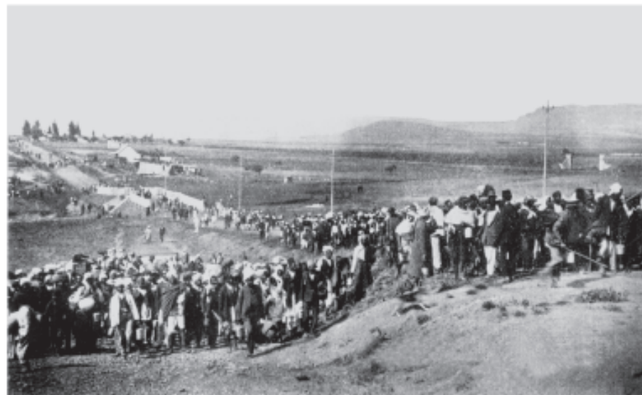
चित्र 2 - दक्षिण अफ़्रीका में भारतीय मज़दूर फ़ोकस्वस्ट से गुज़र रहे हैं, 6 नवंबर 1913

महात्मा गांधी जनवरी 1915 में भारत लौटे। इससे पहले वे दक्षिण अफ़्रीका में थे। उन्होंने एक नए तरह के जनांदोलन के रास्ते पर चलते हुए वहाँ की