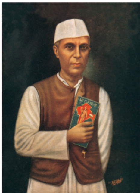
चित्र 13 - जवाहरलाल नेहरू, एक लोकप्रिय चित्र।

ध्यान से देखें कि यहाँ दर्शाई गई माँ की छवि शिक्षा, भोजन और कपड़े दे रही है। एक हाथ में माला उसके संन्यासी गुण को रेखांकित करती है। अपने पूर्ववर्ती रवि वर्मा की भाँति अबनीन्द्रनाथ टैगोर ने भी ऐसी चित्र शैली विकसित करने का प्रयास किया जिसे सच्चे अर्थों में भारतीय माना जा सके।