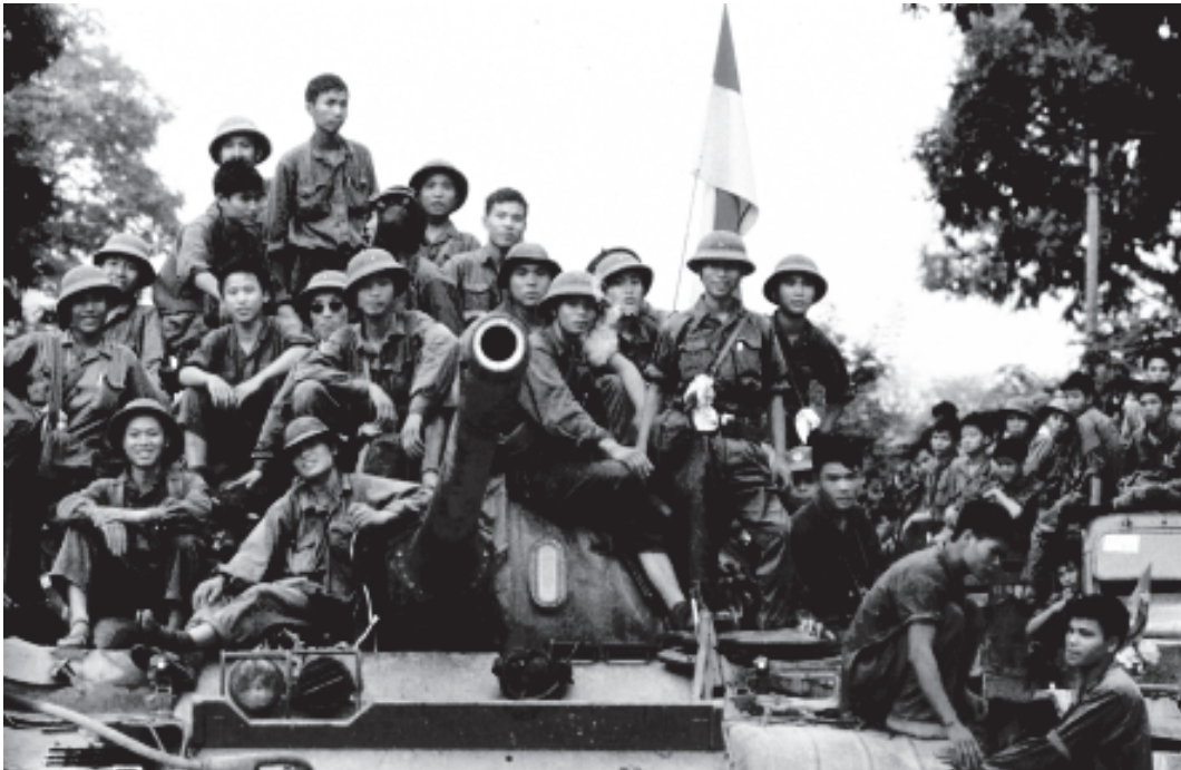
चित्र 21 - साइगॉन को मुक्त कराने के बाद एक टैंक के ऊपर चढ़कर तसवीर खिंचवाते वियेतकाँग सिपाही। इस तसवीर से वियेतनामी राष्ट्रवाद के बारे में क्या पता चलता है ?