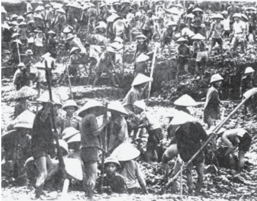
चित्र 15 - टूटी सड़कों की मरम्मत। बमबारी से ध्वस्त होने वाली सड़कों को फटाफट दुरुस्त कर लिया जाता था।