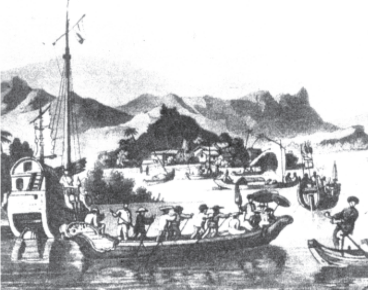
चित्र 2 - फाइफो बंदरगाह।

वियतनाम उस रास्ते से भी जुड़ा रहा है जिसे समुद्री सिल्क रूट कहा जाता था। इस रास्ते से वस्तुओं, लोगों और विचारों की खूब आवाजाही चलती थी। व्यापार के अन्य रास्तों के माध्यम से वियतनाम उन दूरवर्ती इलाकों से भी जुड़ा रहता था जहाँ गैर-वियतनामी समुदाय - जैसे खमेर और कंबोडियाई समुदाय - रहते थे।