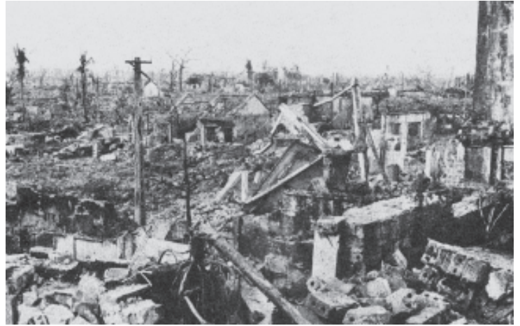
चित्र 13 - दिसंबर 1972 में हनोई पर बमबारी की गई।

वियतनाम में अमेरिकी हमले के दौरान जितने बमों और रासायनिक हथियारों का इस्तेमाल किया गया उनकी मात्रा दूसरे विश्वयुद्ध में इस्तेमाल किए गए हथियारों की मात्रा से भी ज्यादा थी। इन हथियारों को अधिकतर नागरिक आबादियों पर इस्तेमाल किया गया।