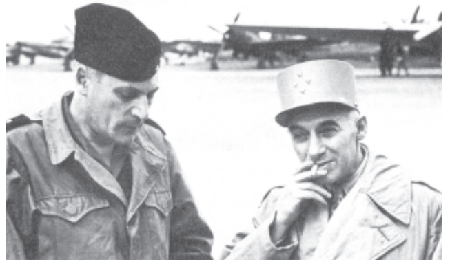
चित्र 10 - इंडो-चाइना में फ़्रांसीसी कमांडर जनरल हेनरी नवारे (दाएँ)। नवारे वियेतमिन्ह के दूरदराज़ ठिकानों पर भी हमला करना चाहता था। उसकी इस रणनीति का नतीजा यह हुआ कि फ़्रांसीसियों ने एक साथ कई मोर्चे खोल दिए और उनकी सेना जगह-जगह बिखर गई। नवारे की योजना दिएन बिएन फू स्थित पूर्वोत्तर घाटी में उलटी पड़ गई और फ़्रांसीसियों को हार का मुँह देखना पड़ा।

उत्तरी वियतनाम में हो ची मिन्ह के नेतृत्व वाली सरकार की सहायता से एन.एल.एफ. ने देश के एकीकरण के लिए आवाज उठाई। अमेरिका इस गठबंधन की बढ़ती ताक़त और उसके प्रस्तावों से भयभीत था। कहीं पूरे वियतनाम पर कम्युनिस्टों का क़ब्ज़ा न हो जाए, इस भय से अमेरिका ने अपनी फ़ौजें और गोला-बारूद वियतनाम में तैनात करना शुरू कर दिया। अमेरिका इस खतरे से सख्ती से निपटना चाहता था।