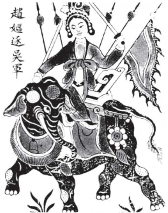
चित्र 17 - त्रियू अयू का चित्र जिसकी पूजा की जाती है। चीनी शासन का विरोध करने वाले विद्रोहियों की आज भी पूजा की जाती है।

अतीत की अन्य विद्रोहिणियाँ भी व्यापक राष्ट्रवादी आख्यान का हिस्सा थीं। इनमें त्रियू अयू सबसे महत्वपूर्ण और सम्मानित रही हैं। तीसरी सदी में पैदा होने वाली त्रियू बचपन में ही यतीम हो गई थीं। माँ-बाप के मरने के बाद