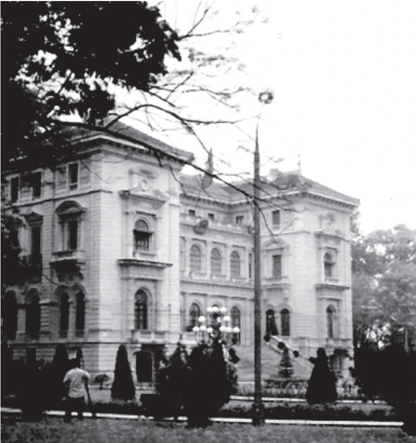
चित्र 7 - आधुनिक हनोई।

आइए स्वास्थ्य और साफ़-सफ़ाई का ही उदाहरण लें। जब फ़्रांसीसियों ने एक आधुनिक वियतनाम की स्थापना का काम शुरू किया तो उन्होंने फ़ैसला लिया कि वे हनोई का भी पुनर्निर्माण करेंगे। एक नए 'आधुनिक' शहर का निर्माण करने के लिए वास्तुकला के क्षेत्र में सामने आ रहे नवीनतम विचारों और आधुनिक इंजीनियरिंग निपुणता का इस्तेमाल किया गया। 1903 में हनोई के नवनिर्मित आधुनिक भाग में ब्यूबॉनिक प्लेग की महामारी फैल गई। बहुत सारे औपनिवेशिक देशों में इस बीमारी को फैलने से रोकने के लिए जो क़दम उठाए गए उनके कारण भारी सामाजिक तनाव पैदा हुए। परंतु हनोई के हालात तो कुछ ख़ास ही थे।