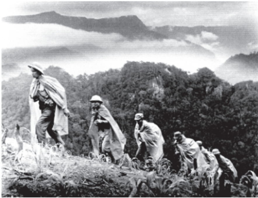
चित्र 16 - हो ची मिन्ह भूलभुलैया मार्ग।