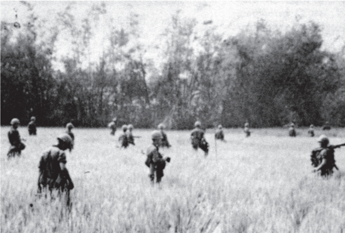
चित्र 12 - वियेतकाँग सिपाहियों की तलाश करते अमेरिकी सैनिक।

अमेरिका के भी युद्ध में कूद पड़ने से वियतनाम में एक नया दौर शुरू हुआ जो वियतनामियों के साथ-साथ अमेरिकीयों के लिए भी बहुत मँहगा साबित हुआ। 1965 से 1972 के बीच अमेरिका के 34,03,100 सैनिकों ने वियतनाम में काम किया जिनमें से 7,484 महिलाएँ थीं। हालाँकि अमेरिका के पास एक से बढ़कर एक आधुनिक साधन और बेहतरीन चिकित्सा सेवाएँ उपलब्ध थीं फिर भी उसके बहुत सारे सैनिक मारे गए। लगभग 47,244 सैनिक मारे गए और 3,03,704 घायल हुए। (घायलों में से 23,014 को भूतपूर्व सैनिक प्रशासन ने स्थायी रूप से अपंग घोषित कर दिया।)