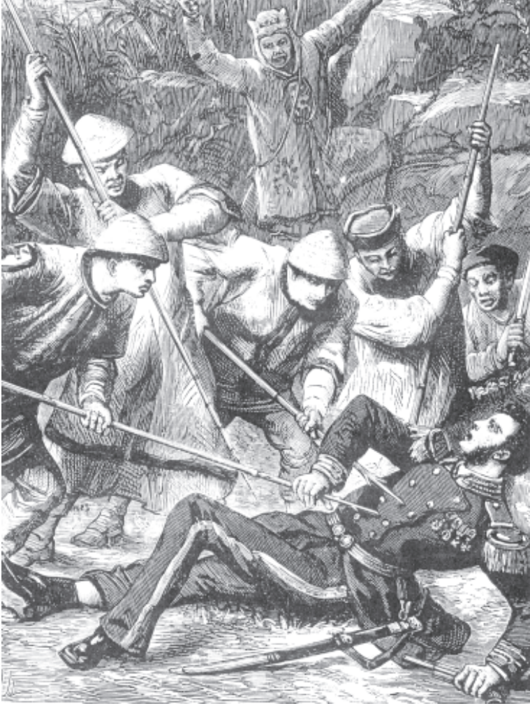
चित्र 3 - नूयेन राजवंश के खिलाफ चढ़ाई का नेतृत्व करने वाले फ्रांसीसी अफसर फ्रांसिस गार्निए की दरबारी सिपाहियों के हाथों हत्या का दृश्य।

गार्निए उस फ्रांसीसी दल का सदस्य था जिसने मेकोंग नदी की खोज की थी। 1873 में फ्रांसीसियों ने गार्निए को उत्तर में स्थित टोंकिन प्रांत में फ्रांसीसी उपनिवेश स्थापित करने का जिम्मा सौंपा था। उसने टोंकिन की राजधानी हनोई पर हमला तो किया लेकिन इस युद्ध में वह खुद मारा गया था।