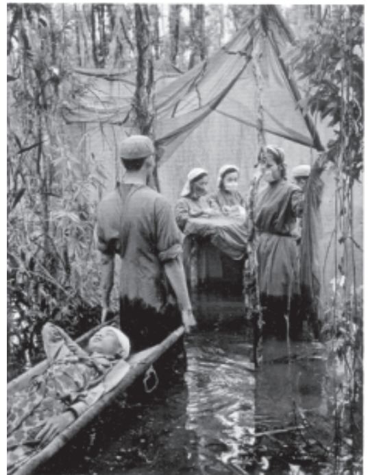
चित्र 19 - घायलों की मरहम-पट्टी करती वियतनामी महिला चिकित्सक।

औरतों के बारे में जिस तरह की कहानियाँ सुनने में आती थीं उनमें बताया जाता था कि औरतें भी सेना में भर्ती होने को बेताब हैं। ऐसी कहानियों में यह विवरण अक्सर आता था : 'गुलाबी गालों वाली मैं औरत भी तुम मर्दों के साथ कंधे से कंधा मिला कर लड़ रही हूँ। जेल मेरी पाठशाला है, तलवार मेरा बच्चा है और बंदूक ही मेरा पति है।'