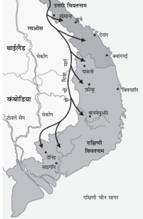
चित्र 14 - हो ची मिन्ह भूलभुलैया मार्ग। ध्यान से देखें कि यह रास्ता लाओस और कंबोडिया से होकर जाता है।

इस मार्ग का ज़्यादातर हिस्सा वियतनाम के बाहर लाओस और कंबोडिया में पड़ता था और उसके कई सिरे दक्षिणी वियतनाम में पहुँच जाते थे। अमेरिकी टुकड़ियों ने वियतनामी सैनिकों के लिए रसद की आपूर्ति को बंद करने के लिए इस मार्ग पर कई बार बम बरसाए। पर बेहिसाब बमबारी के बावजूद वे इस सप्लाई लाइन को ध्वस्त नहीं कर पाए। अमेरिकी इस मार्ग को इसलिए नहीं तोड़ पाए क्योंकि वहाँ के लोग हर हमले के बाद उसकी फ़ौरन मरम्मत कर लेते थे।