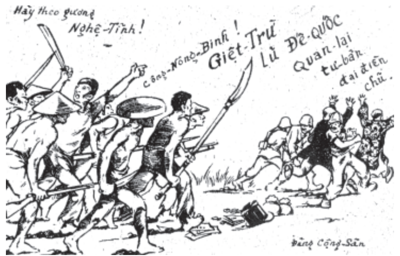
चित्र 9 - साम्राज्यवादियों को खदेड़ते वियतनामी राष्ट्रवादियों को दर्शाता रेखाचित्र। संघर्ष के ऐसे सभी राष्ट्रवादी चित्रों में राष्ट्रवादियों को वीरतापूर्वक आगे बढ़ते हुए, जबकि साम्राज्यवादी शक्तियों को भागते हुए दिखाया जाता था।

लेकिन जल्दी ही वियतनाम का साम्राज्यवाद-विरोधी आंदोलन एक नए प्रकार के नेतृत्व की देखरेख में तेज़ी से आगे बढ़ने लगा।