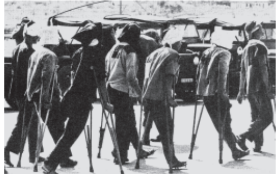
चित्र 20 - समझौते के बाद दक्षिणी वियतनाम में कैद उत्तरी वियतनामी कैदियों को रिहा किया जा रहा है।

सरकारी नीति के खिलाफ व्यापक प्रतिक्रियाओं ने युद्ध खत्म करने के प्रयासों को और बल प्रदान किया। जनवरी 1974 में पेरिस में एक शांति समझौते पर हस्ताक्षर किए गए। इस समझौते से अमेरिका के साथ चला आ रहा टकराव तो खत्म हो गया लेकिन साइगॉन शासन और एनएलएफ के बीच टकराव जारी रहा। आखिरकार 30 अप्रैल 1975 को एनएलएफ ने राष्ट्रपति के महल पर कब्ज़ा कर लिया और वियतनाम के दोनों हिस्सों को मिला कर एक राष्ट्र की स्थापना कर दी गई।