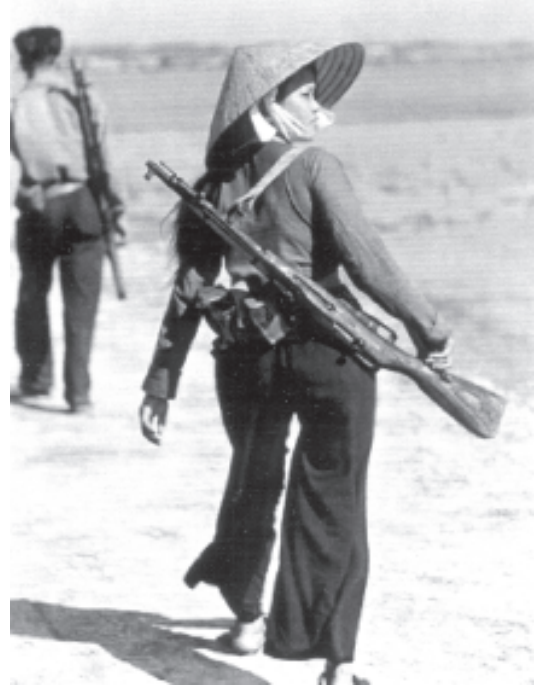
चित्र 18 - एक हाथ में बंदूक।

सत्तर के दशक तक आते-आते शांति प्रक्रिया शुरू हो चुकी थी। युद्ध समाप्त होने के आसार दिखाई देने लगे थे। इसके बाद औरतों को योद्धाओं के रूप में पेश करने का चलन खत्म होने लगा। अब औरतों को मजदूरों के रूप में ही ज़्यादा पेश किया जाने लगा। उन्हें सैनिकों के रूप में नहीं बल्कि कृषि कोऑपरेटिवों, कारखानों और उत्पादन इकाइयों में काम करते हुए दर्शाया जाने लगा।