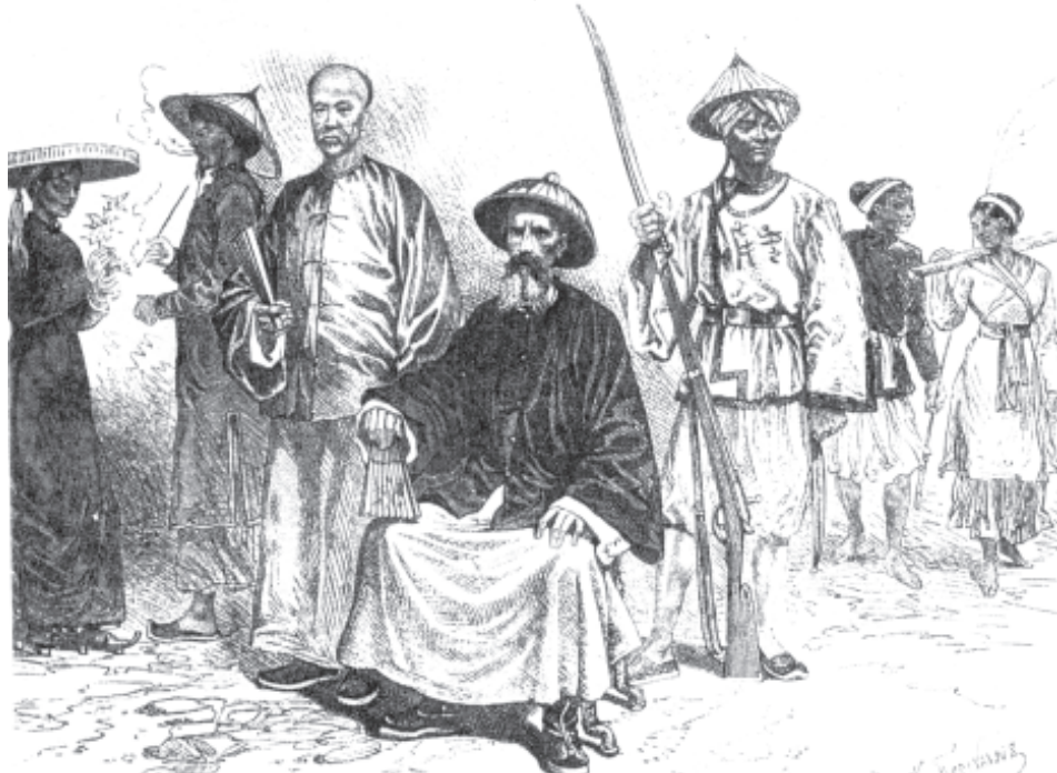
चित्र 5 - वियतनाम में एक फ़्रांसीसी हथियार सौदागर, उन्नीसवीं सदी के अंतिम वर्षों में। ऐसे बहुत सारे लोग मुनाफ़ा कमाने के लिए वियतनाम में घूमते रहते थे। यह सौदागर उन लोगों में था जिन्होंने फ़्रांसीसियों को वियतनाम में अपने अड्डे खोलने के लिए तैयार किया था।

एकतरफ़ा अनुबंध व्यवस्था : वियतनाम के बाग़ानों में इस तरह की मजदूरी व्यवस्था काफ़ी प्रचलित थी। इस व्यवस्था में मजदूर ऐसे अनुबंधों के तहत काम करते थे जिनमें मजदूरों को कोई अधिकार नहीं दिए जाते थे जबकि मालिकों को बेहिसाब अधिकार मिलते थे। अगर मजदूर अनुबंध की शर्तों के हिसाब से अपना काम पूरा न कर पाएँ तो मालिक उनके खिलाफ़ मुकदमे दायर कर देते थे, उन्हें सज़ा देते थे, जेलों में डाल देते थे।