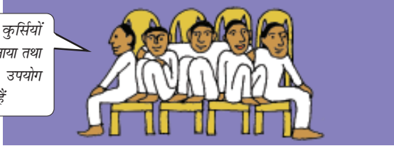
बगैर निर्धन तथा अमीर वाले देश

हमने कुर्सियों को बनाया तथा उनका उपयोग करते हैं