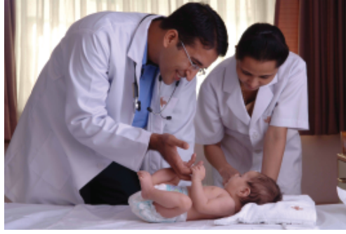
अधिकांश शिशुओं को बुनियादी स्वास्थ्य सुविधाएँ भी नहीं मिल पातीं

यह तालिका क्या दर्शाती है? तालिका का पहला स्तंभ दिखाता है कि केरल में 1000 जीवित पैदा हुए बच्चों में से 11 बच्चे 1 वर्ष की आयु तक पहुँचने से पहले मर जाते हैं, लेकिन पंजाब में यह अनुपात 49 है जो केरल की तुलना में लगभग 5 गुना है। दूसरी ओर पंजाब की प्रतिव्यक्ति आय केरल से कहीं ज्यादा है जैसा तालिका 1.3 में दिखाया गया है। ज़रा सोचिए कि अपने माता-पिता के लिए आप कितने प्यारे हैं, यह सोचिए कि सब लोग कितना प्रसन्न होते हैं, जब कोई बच्चा जन्म लेता है। अब ऐसे माता-पिताओं के बारे में सोचिए जिनके बच्चे अपने पहले जन्म दिन से पहले ही मर जाते हैं। ऐसे माता-पिताओं को कितना दुख महसूस होता होगा। दूसरा, यह देखिए कि यह आँकड़े किस वर्ष के हैं। यह वर्ष 2003 के हैं। तो हम बहुत पुराने समय की बात नहीं कर रहे हैं; यह हमारी स्वतंत्रता के 56 वर्ष बाद की बात है जब हमारे देश के बड़े शहर